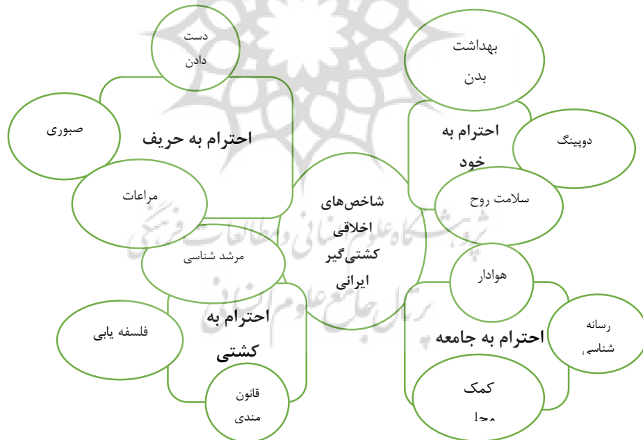
شکل ۲- الگوی شاخص‌های اخلاقی کشتی‌گیر ایرانی

در ادامه می‌توان شاخص‌های اخلاقی یک کشتی‌گیر را در الگوی زیر تحت عنوان الگوی اخلاقی کشتی‌گیر ایرانی ارائه کرد. در این الگو اندازه چهار مؤلفه شناسایی شده با توجه به میزان اهمیت آنان تغییر کرده است.