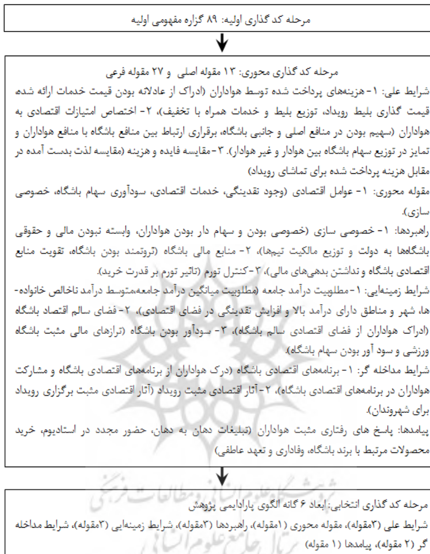
شکل ۲. فرایند مدیریت داده‌ها در سه مرحله کدگذاری

فرایند تحلیل و نامگذاری مفاهیم، طبقه‌بندی و کشف ویژگی‌ها و ابعاد آنها در داده‌ها از طریق انجام مقایسه‌ای مداوم است. در این پژوهش مصاحبه‌ها با استفاده از روش تحلیل محتوا سطر به سطر بررسی،