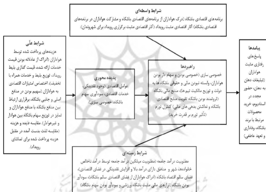
شکل ۲. مدل پارادایمی پژوهش

در کدگذاری باز، گروه پژوهش به پدید آوردن مقوله‌ها و ویژگی‌های آنها می‌پردازد و سپس می‌کوشد مشخص کند که چگونه مقوله‌ها در طول ابعاد تعیین‌شده تغییر می‌کند. در کدگذاری محوری، مقوله‌ها، نظام‌مند بهبود می‌یابد و با زیرمقوله‌ها پیوند داده می‌شود. با این حال، اینها هنوز مقوله‌های اصلی نیست که در نهایت برای تشکیل آرایش نظری بزرگ‌تر یکپارچه شود، فرایند یکپارچه‌سازی و کدگذاری گزینشی به‌طوری‌که نتایج پژوهش شکل نظریه پیدا کند، بهبود مقوله‌هاست که مفاهیم و مقوله‌های استخراج‌شده از داده‌های پژوهش در جدول ۲ مشخص شده است. کدگذاری گزینشی، مرحله اصلی نظریه‌پردازی داده‌بنیاد است که محقق براساس نتایج کدگذاری باز و محوری به ارائه نظریه می‌پردازد.