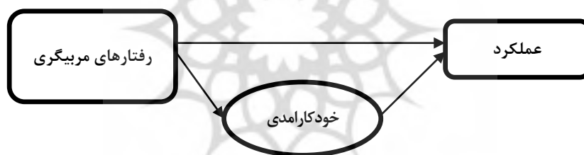
شکل ۱. مدل مفهومی تحقیق

با توجه به مدل مفهومی اسمول و اسمیت (۱۹۹۹)، در خصوص تأثیر فاکتورهای روان‌شناختی بر درک بازیکنان نسبت به رفتارهای مربیگری و واکنش مربیان نسبت به نگرش و درک بازیکنان، مدل مفهومی زیر در خصوص تأثیرگذاری رفتارهای مربیگری بر عملکرد تیمی با میانجیگری خودکارآمدی ارائه شده است.