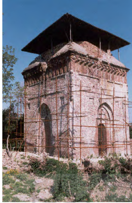
الصورة رقم ٣ الضريح شمس آل رسول