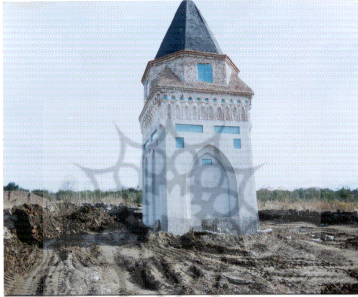
الصورة رقم ١ الضريح ناصر الحق

(آتشكده) وطبقاً للأقوال الشائعة فإن الضريح هو مدفن ناصر الكبير الملقب بحسن بن على الحسينى، ناصر الحق، الداعى الى الحق الذى هو من أئمة الزيدية. بناءً على مكتوب ابن اسفنديار (١) (الذى تم تأليفه فى ٦١٣ ق) فإن ضريح " شمس آل الرسول" يقع فى حى عوامه كوى ( فى بعض النسخ عزامه كوى) وواقع أمام بوابة أمل التى هى الآن الحى الجنوبي للسوق.