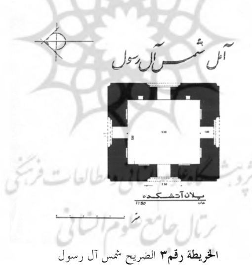
الخريطة رقم ٣ الضريح شمس آل رسول