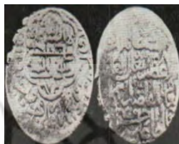
تصویر ۲: سکه حسن‌علی قراقویونلو، نام ائمه اطهار اثنی عشر علیهم‌السلام روی سکه (نک. تراپی طباطبایی، «سکه‌های آق‌قویونلو»، ۱۸).