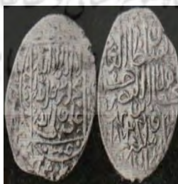
تصویر ۴: سکه اوزون‌حسن، عبارت «علی ولی‌الله» و نام ائمه اطهار علیهم‌السلام همراه نام خلفای راشدین روی سکه (نک. تراپی طباطبایی، «سکه‌های آق‌قویونلو»، ۴۸).