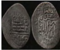
تصویر ۵: سکه اوزون حسن، عبارت «علی ولی الله» و نام خلفای راشدین روی سکه (نک. تراپی طباطبایی، «سکه‌های آق قویونلو»، ۵۰).