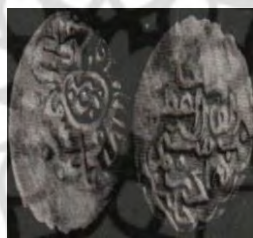
تصویر ۷: سکه رستم آق قویونلو، عبارت «علی ولی الله» روی سکه (نک. تراپی طباطبایی، «سکه‌های آق قویونلو»، ۱۱۶).