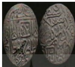
تصویر ۶: سکه یعقوب آق قویونلو، عبارت «علی ولی الله» روی سکه (نک. تراپی طباطبایی، «سکه‌های آق قویونلو»، ۷۵).