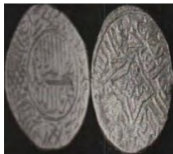
تصویر ۱: سکه جهان‌شاه قراقویونلو، ضرب فیروزکوه، عبارت «علی ولی‌الله» و نام خلفای راشدین روی سکه (نک. تراپی طباطبایی، «سکه‌های آق‌قویونلو»، ۱۸).