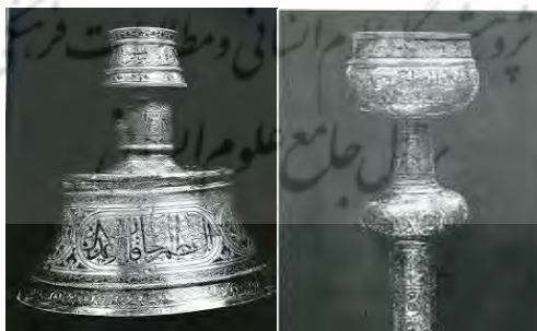
تصویر ۸: چراغ روغنی برنزی از دوران اوزون حسن آق قویونلو، حاوی کتیبه‌ای شامل اسامی دوازده امام علیهم‌السلام (نک. شایسته‌فر، ۱۲۶).