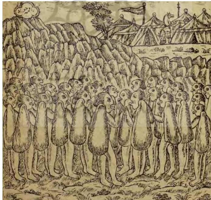
تصویر ۴. یاجوج و ماجوج در پشت سد (نظامی، ۱۳۱۶ق)