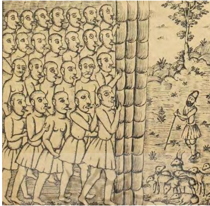
تصویر ۳. یاجوج و ماجوج در پشت سد (نظامی، ۱۲۶۹-۱۲۷۰ق)