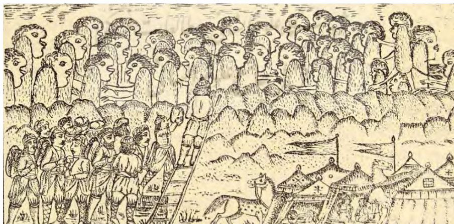
تصویر ۲. ذوالقرنین در حال ساخت سد (نظامی، ۱۳۱۳ق)