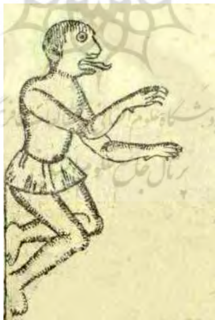
تصویر ۶. یا جوج و ماجوج (نظامی، ۱۲۶۴ق)