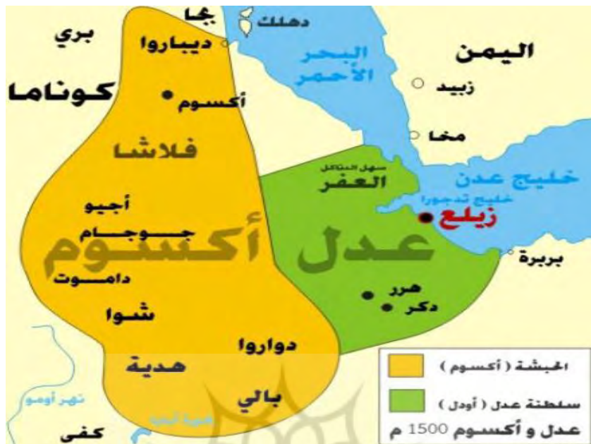
به نقل از کتاب نزهة المشتاق الیمن، ص ۴۶.