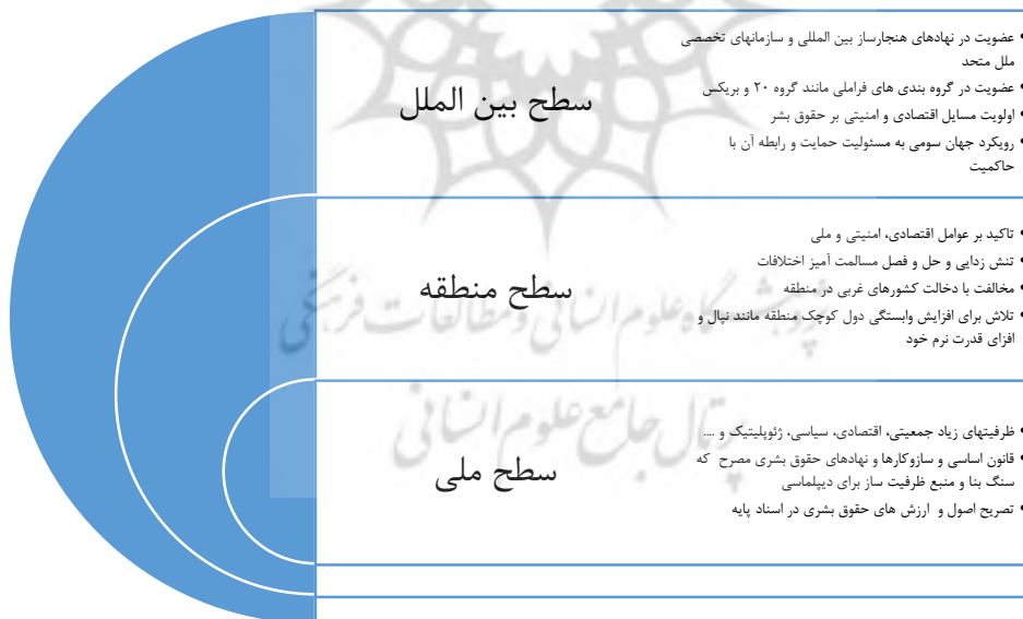
تصویر ۳: جمع بندی