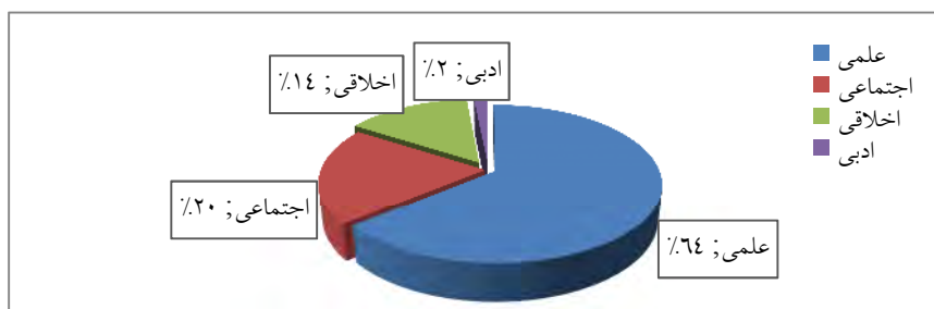
نمودار ۱. تقسیم‌بندی محتوای مطالب کتاب

کمترین توجه را به ادبیات مبذول داشته اند و به مسائل اجتماعی و اخلاقی نیز در حد متوسط پرداخته‌اند.