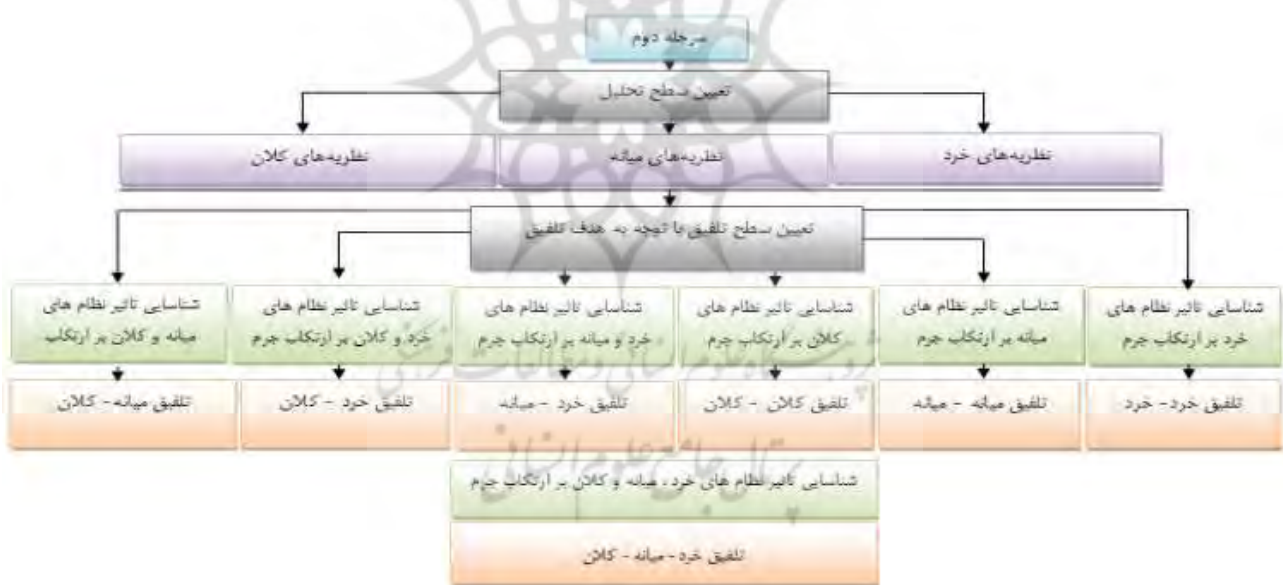
دومین مرحله ساخت نظریه تلفیقی

به نظریه دیگر منتقل سازد. در نقطه مقابل، زمانی که نظریه-پرداز به دنبال ادغام مفاهیم مندرج در نظریه‌های گوناگون است باید از روش تلفیق مفهومی استفاده کند. برای نیل به این هدف، ابتدا مفاهیم اساسی نظریه‌ها را مورد شناسایی قرار می‌دهد، سپس مفاهیم را از نظریه‌های مختلف اخذ