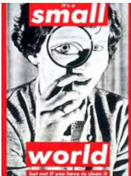
تصویر ۳ دنیای کوچکی است، اما نه چنان‌چه مجبور به پاک‌سازی آن باشید، اثر باربارا کروگر. منبع: بهارلو و همکاران (۱۳۹۰)