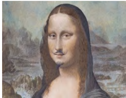
Figure 5. Mona Lisa with beard and mustache, Marcel Duchamp