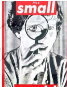
Figure 1. Fountain Marcel Duchamp