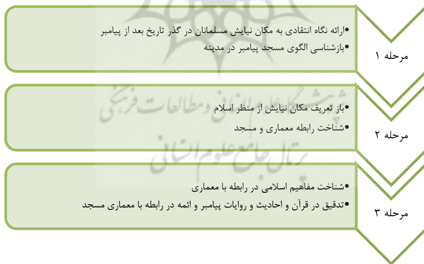
شکل شماره ۴: مفاهیم شکلی و محتوایی ارائه شده در مقاله

"در بناهای مذهبی درون شهرها، مسجد جایگاه ویژه‌ای را به خود اختصاص می‌دهد. مسجد به‌مثابه برجسته‌ترین عنصر معمارانه منبعث از دین اسلام از اولین ازمینه حضور مدنی این دین، با جامعه همراه بوده است. مسجد کانون عبادتی، اجتماعی، فرهنگی فرهنگ دیرپای است که هرگز نمی‌تواند از ساختار اجتماعی و شهری آن جدا شود. از این‌رو، مسجد را می‌توان به‌عنوان محوری‌ترین، کانونی‌ترین و ارزشمندترین عنصر کالبد متبلورکننده‌ی مدنیت جامعه اسلامی دانست" (بهرامی و همکاران، ۱۳۹۳: ۴). به‌نظر می‌رسد عنایت به احادیث و روایاتی که از پیامبر و ائمه معصوم به‌جا مانده، درطول تاریخ اسلام از مغفولات زندگی مسلمانان بوده است. چراکه، همان‌طور که در این مقاله گوشه کوچکی از گذشته معماری و ساخت مسجد را بررسی کردیم متوجه شدیم آنچه که به‌عنوان سنت پیامبر در امر مسجد سازی شاهد آن هستیم با آنی که پیامبر خود با دستان خویش برپا داشت تفاوت‌های بنیادینی دارد. به‌هرحال به‌نظر نگارنده جامعه‌ی معماری معاصر ما می‌باید آموزه‌های اصیل اسلامی را در برپا داشتن این مکان مقدس به‌کار گیرد و به نگاهی انتقادی به آنچه که امروزه به‌عنوان اساس معماری این مکان خوانده می‌شود اهتمام ورزد. برای دستیابی به این مهم می‌بایست با درهم‌آمیزی کارکردهای محتوایی و عملکردهای کالبدی، طرحی را به اجرا بگذارد که از یک طرف با دستورات دینی مغایر نباشد و از طرف دیگر با حفظ قابلیت انعطاف، از جمود و ایستادگی در یک کالبد متعین جلوگیری کند (ن. ک شکل شماره ۴).