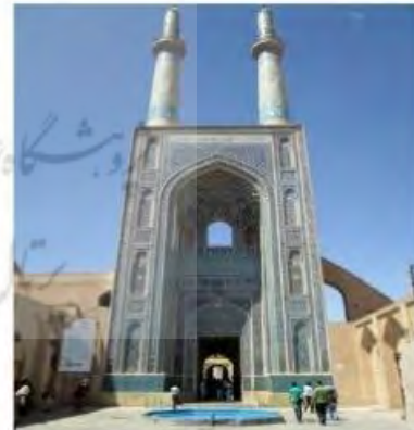
شکل شماره ۲: تزئینات و الحاقات مخالف با دستورات اسلام در مسجد شیخ زاهد و سردر ورودی مسجد جامع یزد (عصر ایران، ۱۳۹۹)