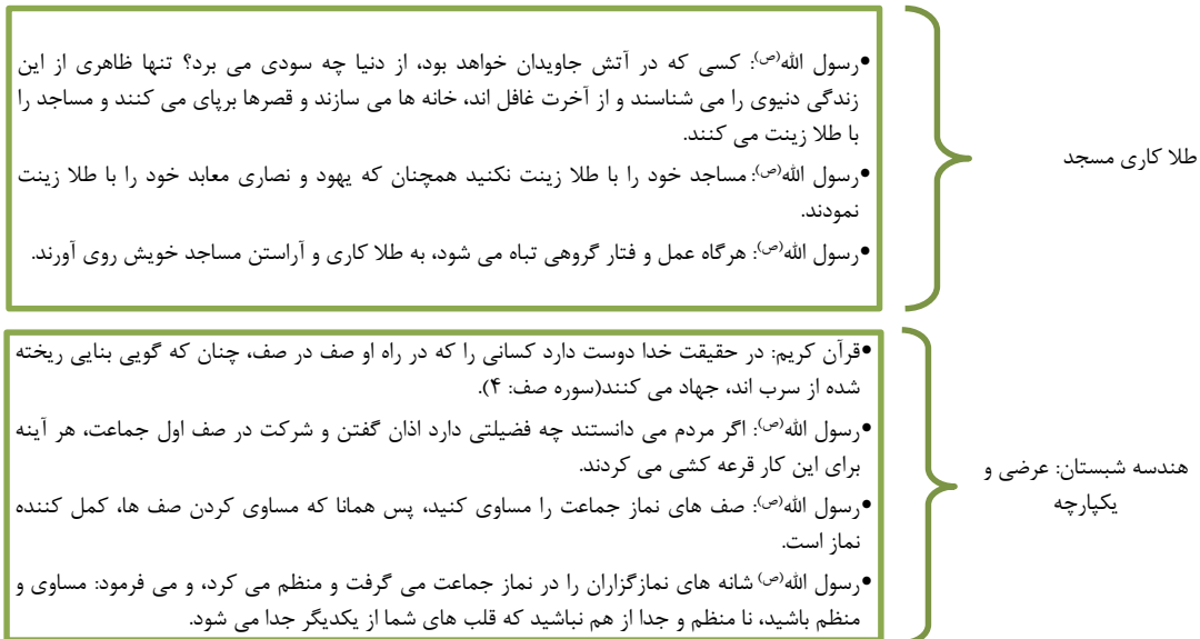
شکل شماره ۳: احادیث و روایات پیامبر (ص) و ائمه (ع) پیرامون معماری مسجد (اکبرزاده، ۱۳۹۳: ۱۴۳-۱۴۲)

"در بناهای مذهبی درون شهرها، مسجد جایگاه ویژه‌ای را به خود اختصاص می‌دهد. مسجد به‌مثابه برجسته‌ترین عنصر معمارانه منبعث از دین اسلام از اولین ازمینه حضور مدنی این دین، با جامعه همراه بوده است. مسجد کانون عبادتی، اجتماعی، فرهنگی فرهنگ دیرپای است که هرگز نمی‌تواند از ساختار اجتماعی و شهری آن جدا شود. از این‌رو، مسجد را می‌توان به‌عنوان محوری‌ترین، کانونی‌ترین و ارزشمندترین عنصر کالبد متبلورکننده‌ی مدنیت جامعه اسلامی دانست" (بهرامی و همکاران، ۱۳۹۳: ۴). به‌نظر می‌رسد عنایت به احادیث و روایاتی که از پیامبر و ائمه معصوم به‌جا مانده، درطول تاریخ اسلام از مغفولات زندگی مسلمانان بوده است. چراکه، همان‌طور که در این مقاله گوشه کوچکی از گذشته معماری و ساخت مسجد را بررسی کردیم متوجه شدیم آنچه که به‌عنوان سنت پیامبر در امر مسجد سازی شاهد آن هستیم با آنی که پیامبر خود با دستان خویش برپا داشت تفاوت‌های بنیادینی دارد. به‌هرحال به‌نظر نگارنده جامعه‌ی معماری معاصر ما می‌باید آموزه‌های اصیل اسلامی را در برپا داشتن این مکان مقدس به‌کار گیرد و به نگاهی انتقادی به آنچه که امروزه به‌عنوان اساس معماری این مکان خوانده می‌شود اهتمام ورزد. برای دستیابی به این مهم می‌بایست با درهم‌آمیزی کارکردهای محتوایی و عملکردهای کالبدی، طرحی را به اجرا بگذارد که از یک طرف با دستورات دینی مغایر نباشد و از طرف دیگر با حفظ قابلیت انعطاف، از جمود و ایستادگی در یک کالبد متعین جلوگیری کند (ن. ک شکل شماره ۴).