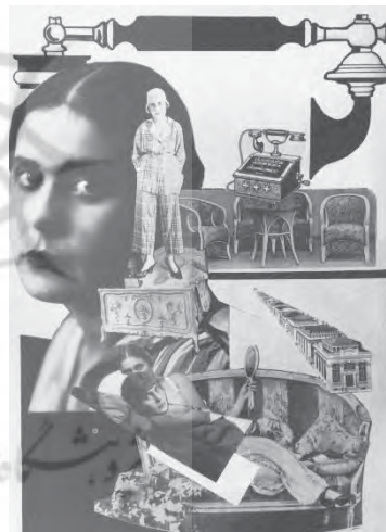
تصویر ۴- عکس الکساندر رودچنکو فتومونتاژ، ۱۹۲۳ م. (URL3).

او در فتومونتاژی - که برای کتاب مایا کوفسکی در سال ۱۹۲۳ کار کرد- با تلفیقی از تصاویر زنان در حالات مختلف، همجوار با اشیایی مدرن زندگی، مانند تلفن به ارائه آزادتر شکل و محتوا در کنار هم پرداخت. به این ترتیب بود که شیوه فتومونتاژ در امر تبلیغات، عنصری قدرتمند قلمداد شد. قرار گرفتن این دو روش، عکاسی مد و فتومونتاژ در عصر تولید انبوه اشیای مصرفی به شکلی پیوسته با هم، به کمک ابژه قدرتمند و ثابت زن، مقدمه ساز مرحله‌ای تازه از تغییر شکل، معنا و فرهنگ در هنر شد.