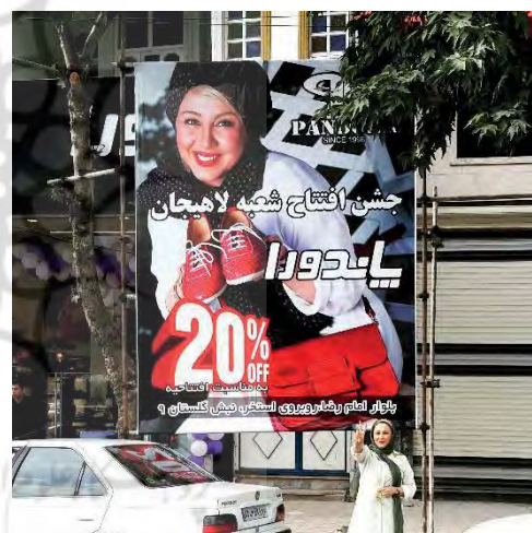
تصویر ۱۶- تبلیغ محیطی، تبلیغ برند پاندورا، ۱۳۹۲ (URL4).