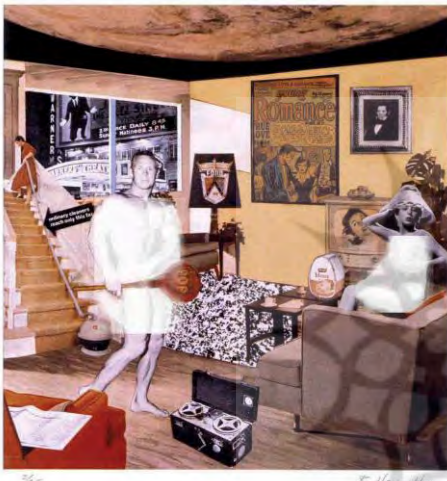
تصویر ۷- ریچارد همیلتون، آنچه خانه‌های امروزی را متفاوت تر و جذاب تر می‌کند، کولاژ، ۱۹۵۶ م. (URL3).

هنرمندان پیرو این شیوه هنری - که عامه مردم را مخاطب قرار می‌داد- در سال ۱۹۵۶ نمایشگاهی تحت عنوان «فردا این چنین است» برگزار کردند. نمایشگاه به شکلی طراحی شد که بازدیدکنندگان را به ادراک محیط آینده سوق می‌داد (لوسی اسمیت، ۱۳۸۰: ۱۴۶). در فضای ورودی گالری، اثر ریچارد همیلتون ۲۱ که متشکل از کولاژی‌هایی برگرفته از تصاویر و عکس-های عاریتی از مجلات مختلف و منابع دیگر خودنمایی می‌کرد. این اثر با نام «آنچه خانه‌های امروزی را متفاوت تر و جذاب تر می‌کند» (تصویر ۷) (همان: ۱۱۹)، کولاژی از یک خانه مدرن است که انباشتگی آن از کالاهای مصرفی دنیای تکنولوژیک را در کنار یک زن برهنه با حالتی طنزآمیز به نمایش می‌گذارد.