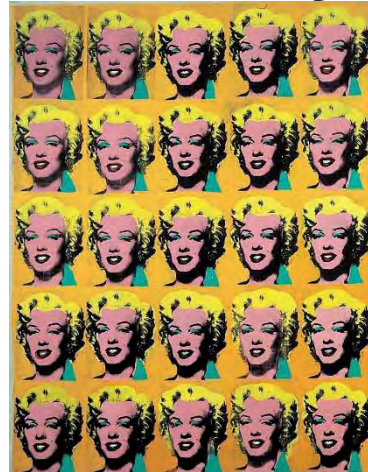
تصویر ۵- اندی وار هول، مرلین مونرو، ۱۹۶۲ م. (URL3).

به مخاطب القا می‌کند، و نقد و سخره خود را با این شیوه نشان می‌دهد.