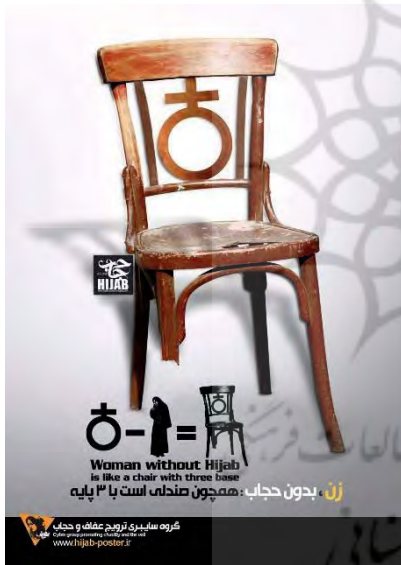
تصویر ۱۴- تبلیغ محیطی، موضوع حجاب، (URL1)۱۳۹۳.

تا این نتیجه حاصل شود که در صورت رعایت حجاب، این زن به مثابه کالا، مصرف بهینه‌تری خواهد داشت. یا حتی به راحتی، با وسایل و اشیای مصرفی دیگری همچون صندلی مقایسه می‌شود که با پیام «زن بدون حجاب، همچون صندلی است با سه پایه» (تصویر ۱۴)؛ روند شی‌وارگی، بی‌هویتی و بی‌معنا کردن آن را تأکید می‌کند.