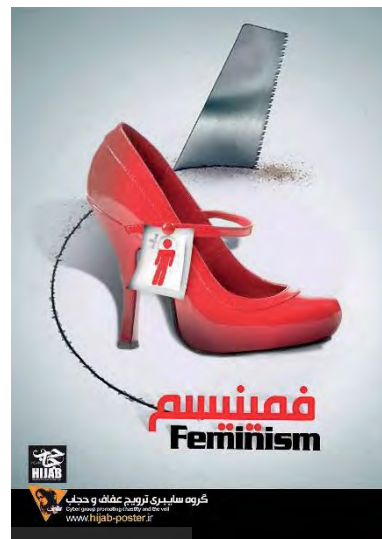
تصویر ۱۵- تبلیغ محیطی، ۱۳۹۳ (URL1).

زن به مانند الگوی کشورهای پیشرفته غربی در حال ارائه کالاهای مصرفی، مانند لوازم خانگی یا لباس، کیف و کفش و غیره برای شهروندان است (تصویر ۱۶).