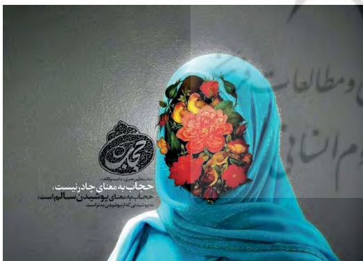
تصویر ۱۰- تبلیغ محیطی، موضوع حجاب، ۱۳۹۳ (URL2).

دیگرگون‌تر می‌کرد؛ تا در دوران انقلاب اسلامی که ایران دچار تغییری بزرگ، یعنی تغییر نظام مذهبی و سیاسی در روند زندگی و فرهنگ توده مردم شد. و به دنبال این تغییر، تعیین خطوط و حد و مرزهای بیانی و تصویری، این روند تغییر معنایی را به شکلی دیگر و در مسیری متفاوت دنبال کرد. استفاده از تصویر و بدن زن در آثار هنری و تبلیغات، بنابر موازین اعتقادی و فرهنگی جمهوری اسلامی، ممنوع و غیراخلاقی قلمداد می‌شد. پس، به‌طور معمول، در تبلیغات محیطی و نشریات و تیزرها استفاده نمی‌شد. اما گویی این روند نتوانسته است در مقابل این تغییر معنایی حاکم بر عصر مدرن و پست مدرن جهانی، مقاومت کند و در برخی موارد، دچار تناقض‌های معنایی و تصویری درون خود می‌شود. به‌طوری که امروزه، ما در مشی تبلیغات و گرافیک به مثابه هنری صنعتی، در قالب تیزرهای تلویزیونی و البته، تبلیغات محیطی تجاری یا فرهنگی شاهد حضور پررنگ زنان در تبلیغات مختلف از کالاهای مصرفی و همچنین ارائه دهندگان شعارهایی فرهنگی و اجتماعی هستیم که با کیفیاتی شاید نه چندان مطلوب، اما دنبال رو مشی حاکم بر جهان تبلیغات، یا به تعبیری بهتر، مشی حاکم بر جهان پست مدرن است و همواره، هویت و معنای زن را دچار اعوجاج و تکثر و در نهایت، به بی مفهومی می‌کشاند؛ که البته، این خصیصه اجتناب‌ناپذیر و قدرتمند دوران پست مدرن است.