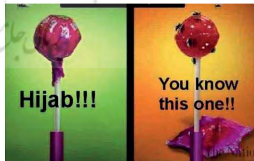
تصویر ۱۲- تبلیغ محیطی، موضوع حجاب، (URL2)۱۳۹۴.

همان‌طور که در سطح شهرهای ایران مشاهده می‌شود، حتی زن در کنار برچسب کیفیت مصرفی کالاهای مصرفی (تصویر ۱۳)، قرار می‌گیرد، تا هویتی کالاگونه بیش‌تر به او تحمیل شود.