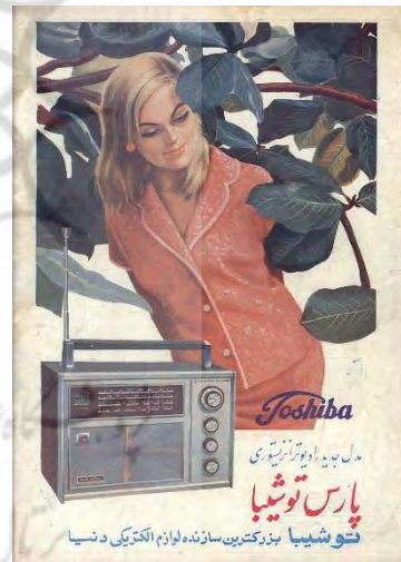
تصویر ۹- تبلیغ محیطی و مجله، تبلیغ رادیو، ۱۳۵۰ (URL3).

دیگرگون‌تر می‌کرد؛ تا در دوران انقلاب اسلامی که ایران دچار تغییری بزرگ، یعنی تغییر نظام مذهبی و سیاسی در روند زندگی و فرهنگ توده مردم شد. و به دنبال این تغییر، تعیین خطوط و حد و مرزهای بیانی و تصویری، این روند تغییر معنایی را به شکلی دیگر و در مسیری متفاوت دنبال کرد. استفاده از تصویر و بدن زن در آثار هنری و تبلیغات، بنابر موازین اعتقادی و فرهنگی جمهوری اسلامی، ممنوع و غیراخلاقی قلمداد می‌شد. پس، به‌طور معمول، در تبلیغات محیطی و نشریات و تیزرها استفاده نمی‌شد. اما گویی این روند نتوانسته است در مقابل این تغییر معنایی حاکم بر عصر مدرن و پست مدرن جهانی، مقاومت کند و در برخی موارد، دچار تناقض‌های معنایی و تصویری درون خود می‌شود. به‌طوری که امروزه، ما در مشی تبلیغات و گرافیک به مثابه هنری صنعتی، در قالب تیزرهای تلویزیونی و البته، تبلیغات محیطی تجاری یا فرهنگی شاهد حضور پررنگ زنان در تبلیغات مختلف از کالاهای مصرفی و همچنین ارائه دهندگان شعارهایی فرهنگی و اجتماعی هستیم که با کیفیاتی شاید نه چندان مطلوب، اما دنبال رو مشی حاکم بر جهان تبلیغات، یا به تعبیری بهتر، مشی حاکم بر جهان پست مدرن است و همواره، هویت و معنای زن را دچار اعوجاج و تکثر و در نهایت، به بی مفهومی می‌کشاند؛ که البته، این خصیصه اجتناب‌ناپذیر و قدرتمند دوران پست مدرن است.