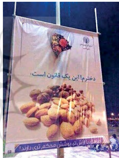
تصویر ۱۱- تبلیغ محیطی، موضوع حجاب، (URL2)۱۳۹۴.

شیوه‌ای دیگر از کالاگونگی زن را شاهد هستیم؛ تا جایی که زن با کالاها و اشیای مصرفی مقایسه می‌شود. مثلاً با برخی خوراکی‌ها، همان‌طور که در تصاویر زیر مشخص است، زن با بادام و گردو که پوست و پوششی محکم برخوردارند و دست‌یابی به اینها مشکل‌تر است، مقایسه می‌شود. به این ترتیب، گردو یا امثال آن، به مثابه زنی شمرده می‌شوند که حجاب کامل را رعایت می‌کند؛ پس مانند آن گردو، دست‌یابی به آن ناممکن‌تر است. یا تبلیغی که زن را به مثابه یک شکلاتی ارائه می‌دهد که اگر دارای پوشش باشد از گزند مگس‌ها که به دنبال شیرینی آن هستند در امان خواهند ماند (تصاویر ۱۱ و ۱۲) (مقایسه‌ای مستقیم بین مفهوم زن و اجناس مصرفی).