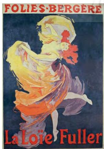
تصویر ۱- پوستر فولیس برگر، اندازه ۲،۵ متر، ژول شر، ۱۸۶۶

پوستر به عنوان محصولی اساسی و یکی از پایه‌های مهم صنعت گسترده چاپ و تبلیغات محسوب می‌شود. در اواخر قرن نوزدهم، پوسترها در خیابان‌های شهرهای رو به توسعه، معرف زندگی اقتصادی، اجتماعی و فرهنگی جامعه بودند و برای جلب توجه خریداران اجناس و طرفداران و سرگرمی‌ها با هم رقابت داشتند. پوستره‌های رنگی - که با امکانات فن لیتوگرافی آن زمان چاپ می‌شدند - توجه عابران را به خود جلب می‌کردند. این پوسترها نوعی سادگی در طراحی را - که از محدودیت‌های چاپ مشتق شده بود - برداشتند. در واقع، هنر چاپ پوستر با سرمشق گرفتن از خط مشی ژول شر ۸ ارائه و تکمیل شد. او بود که از سال ۱۸۶۶م. چاپ پوسترها را به شیوه امروزی‌نش با اندازه‌هایی بیش از دو متر رواج داد. اغلب این پوسترها، موضوعی مشترک برای فروش کالا یا بیان اطلاعات عمومی داشتند و از نقش یک زن جوان، به اندازه طبیعی، به همراه شعاری در بالا یا پایین کادر استفاده می‌کردند. توجه اصلی هنرمند بر استفاده از زیبایی زنانه جهت جذب مخاطب بود؛ به طوری که از رنگ‌ها و فرم‌های زیبا برای تاثیرگذاری بیش‌تر زنان استفاده می‌شد (هولیس، ۱۳۸۱: ۲۳).