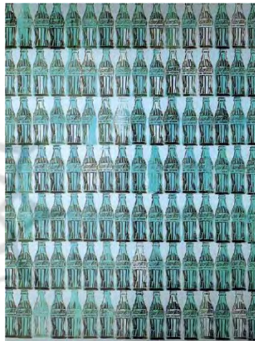
تصویر ۶- اندی وار هول، کوکاکولا، ۱۹۶۲ م. (URL3).

هنرمندانی که در این شیوه پاپ‌آرت کار می‌کردند، در واقع، در سطحی بزرگ به موضوعات می‌پرداختند و هرگز مخالف افراط‌گرایی نبودند (جیمسون، ۱۳۹۱: ۱۲)؛ بلکه با این شیوه به بیان و نقد وقایع حاکم بر دوران مدرن می‌پرداختند در حقیقت، این شیوه تمایل به دریافت تصاویری از نیروی واقعی اجتماعی را در زیر پوسته سطحی واقعیت بیان می‌کند (همان: ۱۱۹). این شیوه، انبوه تصاویر، کالاها و بدن‌هایی هستند که در قالب عکس‌ها و طرح‌هایی مونتاژ و کولاژ شده‌اند، و دایما در حال تکرار و بازتولید هستند. در حقیقت، این آثار با این شیوه، تاثیری طلسم‌گونه را به تماشاگر یا مخاطب ارائه می‌دهند. این سبک به این شکل تاثیر آن‌ها را تشدید می‌کند و بر ابتدال ابژه‌ها و مفاهیم اشاره دارد. این ابتدال، خود در عمل تکثیر و تکرار، معیاری می‌شود برای ارزش و تحسین آنچه که ساختار اثر را تشکیل داده است (تاسک، ۱۳۷۷: ۲۳۶).