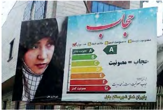
تصویر ۱۳- تبلیغ محیطی، موضوع حجاب، (URL2)۱۳۹۴.

تا این نتیجه حاصل شود که در صورت رعایت حجاب، این زن به مثابه کالا، مصرف بهینه‌تری خواهد داشت. یا حتی به راحتی، با وسایل و اشیای مصرفی دیگری همچون صندلی مقایسه می‌شود که با پیام «زن بدون حجاب، همچون صندلی است با سه پایه» (تصویر ۱۴)؛ روند شی‌وارگی، بی‌هویتی و بی‌معنا کردن آن را تأکید می‌کند.