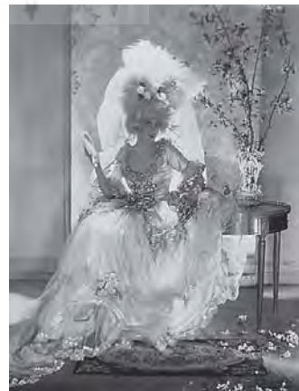
تصویر ۲- عکس بارون آدولف دی میر هلن لی ورثینگ، ۱۹۲۰ م. (URL3).

نگرشی واقع‌گرایانه به عکاسی حاکم شده بود. عکس در لحظه‌ای از تاریخ فرهنگی اهمیت پیدا می‌کرد که همگان تصور می‌کردند که حق دارند از موهبتی به نام «اخبار» مطلع شوند؛ پس عکس‌ها به عنوان راهی برای اطلاع‌رسانی برای عامه مردم به کار گرفته شدند (همان). در واقع، دوران جنگ جهانی اول، مرحله انتقال بین مفاهیم جدید و قدیم در عکاسی بود؛ به دلیل حال و هوای جنگ تحول و کاربرد عکس در روزنامه‌ها و مجلات عنصری اساسی شد و از سال ۱۹۱۹م. به بعد، مفهوم «رسانه» را یافت و بستر مناسبی برای عکاسی مد و تبلیغات، فراهم شد. برای ورود به این عرصه، عکاسان با رویکرد خاص عکاسی پرتره، تکنیک‌های تصویرگرایی را با چهره‌ها ترکیب می‌کردند. این جنبش، شبیه آرت نوو و تاثیرش بر پوستره‌های گرافیکی بود. در این شیوه، اسباب و وسایل تزئینی منازل و دکورسازی در دهه‌های ۲۰ و ۳۰ استفاده می‌شد. این سبک در سال ۱۹۶۱ به «آرت دکو» ۱۱ معروف شد و مستقیماً بر پوسترها و آگهی‌های تبلیغاتی و عکس‌ها تاثیر گذاشت. با مستحکم شدن و توسعه فراگیر این سبک در عکاسی پرتره و فیگور انسانی، حضور زن در عکس‌ها پررنگ و پررنگ‌تر شد و میزان اغواگری در حالات زنانه نیز بالاتر رفت. بارون آدولف دی میر، ۱۲ یکی عکاسان این سبک در عکس زیر (تصویر ۲)، توانست مفهوم اغواگری و فریبندگی مدل زن را با لباسی بورژوازی و احاطه شده در دکوری از لوازم خانگی گران‌قیمت برای نشان دادن جلوه‌ای خاص به مدل، طراحی کند. در این گونه آثار، شاهد شروع هم‌جواری زن در کنار اشیای زندگی مدرن هستیم که در آن‌ها زن به عنوان ابژه‌ای تجملاتی و زینتی با خصیصه این اشیا همراه بوده است، به تصویر کشیده می‌شد.