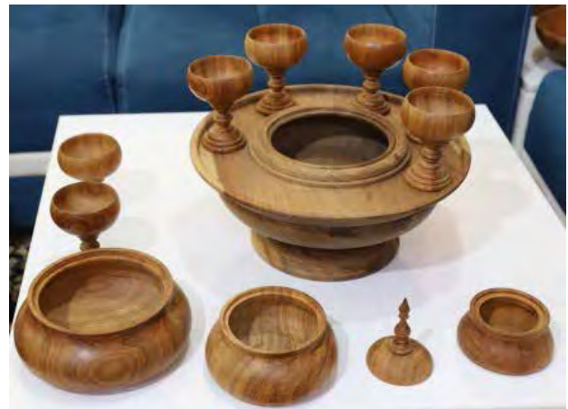
تصویر ۷. جزئیات اثر برگزیده ۲۰۱۲. عکس: مزده درخشانی، ۱۳۹۷.

پیش شرط‌های این بند، نسبت بین قیمت و کیفیت، عملکرد محصول (کاربرد)، رقابت‌پذیری و توان عرضه در بازار جهانی، بسته‌بندی و ایجاد اشتغال پایدار است. برای تبیین این بند پرداختن به تعریف صحیحی از بازاریابی ضروری به نظر می‌رسد. اندیشمندان حوزه بازاریابی، تعاریف متعدد و گسترده‌ای از واژه بازاریابی ارائه داده‌اند. «کاتلر» و «آرمسترانگ» از مشهورترین اندیشمندان حوزه بازاریابی، تعریف خود را از بازاریابی این گونه ارائه کرده‌اند: «بازاریابی، فرایندی اجتماعی و مدیریتی است که به وسیله آن، هر فرد نیازها و خواسته‌های خود را از طریق تبادل ارزش با دیگران برآورده می‌سازد. به زبان ساده‌تر، بازاریابی شامل ایجاد رابطه‌ای تبادلی و پرارزش با مشتری است» (کاتلر و آرمسترانگ، ۱۳۸۹، ۵). در این فرآیند هنرمند به عنوان تولیدکننده، با عرضه محصول صنایع دستی، چرخه بازاریابی را فعال می‌سازد که نسبت صحیح قیمت با کیفیت اثر، به عنوان محصول و یا «قیمت منصفانه» نقش به سزایی در بازاریابی دارد. مورد دیگر در بازاریابی محصولات صنایع دستی، کاربردی بودن و عملکرد آن است که می‌تواند