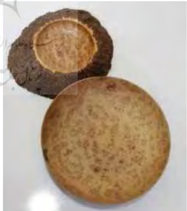
تصویر ۱۰. نمونه خراطی بر روی چوب گره درخت کیکم.