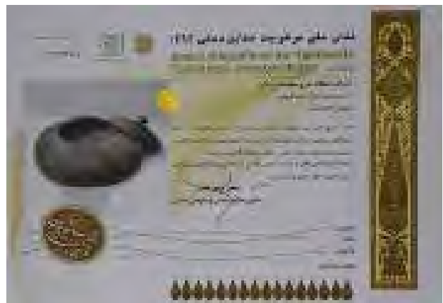
تصویر ۲. نشان ملی مرغوبیت در سال ۱۳۹۴. عکس: مزده درخشانی، ۱۳۹۷.