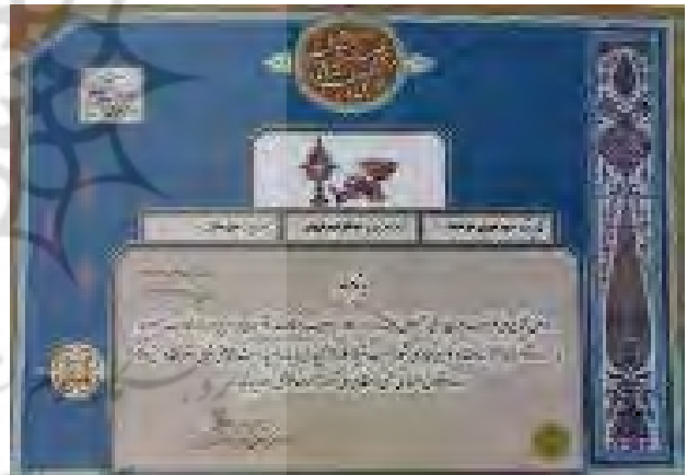
تصویر ۱. نشان ملی مرغوبیت در سال ۱۳۹۴.

هنرهای صنایع دستی، به‌عنوان بخشی مهم و تأثیرگذار در هر جامعه‌ای محسوب می‌شوند، و از دید نظریه‌پردازانی چون «بوردیو»، در زمره «سرمایه فرهنگی» قرار می‌گیرند. سرمایه فرهنگی «بوردیو» مشتمل بر سه جنبه است؛ «تجسم ۲۰ » در محدوده تفکر، «تجسم مادی و بیرونی ۲۱ » که دربرگیرنده تولیدات هنری و فرهنگی است و «سرمایه فرهنگی نهادی» که