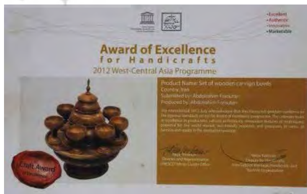
تصویر ۶. اثر خراطی برگزیده سال ۲۰۱۲. عکس: مژده درخشانی، ۱۳۹۷.