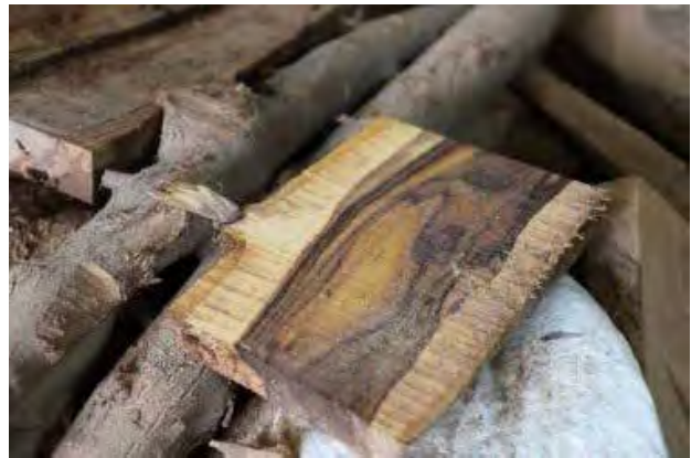
تصویر ۸. نمونه بافت چوب در برش عمودی و طی مراحل خراطی. عکس: مؤده درخشانی، ۱۳۹۷.

همان‌گونه که از نظر گذشت، شش معیار؛ احترام به ارزش‌های محیط‌زیست در اصالت مواد به کاررفته در اثر و تکنیک‌های تولید، مسئولیت اجتماعی، مرغوبیت و کیفیت مورد نظر معیارهای جهانی صنایع دستی، قابلیت بازاریابی محصولات صنایع دستی با توانمندی عرضه در بازارهای جهانی، ابتکار در طراحی و تولید، بیان هویت فرهنگی و ارزش‌های زیباشناختی سنتی، از مهم‌ترین‌هایی بودند که در آثار خراطی «عبدالرحیم فروتن» اجرا و به کار گرفته شده‌اند. به بیان دیگر رعایت حق کپی‌رایت، حقوق اجتماعی، اصالت ایده، مرغوبیت، کیفیت مواد اولیه، مورد توجه‌بودن هویت و اصول زیباشناسی سنتی، در نظرداشتن مسائل زیست‌محیطی چون مدیریت پسماند، در کنار قابلیت بازاریابی و عرضه در بازارهای جهانی، ارکان اصلی اصالت یک اثر است. این معیارها همان‌گونه که از نظر گذشت از ابتدا تا انتهای تولید و عرضه در آثار این هنرمند اجرا شده است که این مهم می‌تواند به راحتی در کارگاه‌های ساده و به دور از امکانات ویژه در تمام مناطق کشور به دست آید. لازمه این امر بالابردن افق انتظار هنرمندان و علاقه‌مندان به هنر صنایع دستی با رعایت معیارهای کاملاً عملی برشمرده شده در این پژوهش است. البته حصول آن مستلزم برخی عوامل