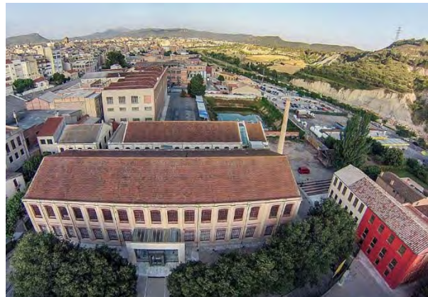
شکل ۵ مجموعه ساختمان‌های موزه چرم ایگوالادا؛ سمت راست شکل دباغی آدوریلابلا و سمت چپ کال گرونوتز و کال بویر را نشان می‌دهد.

محلی به نشانه‌ای شهری و افزایش حس تعلق به مکان در مردم موفق بوده است.