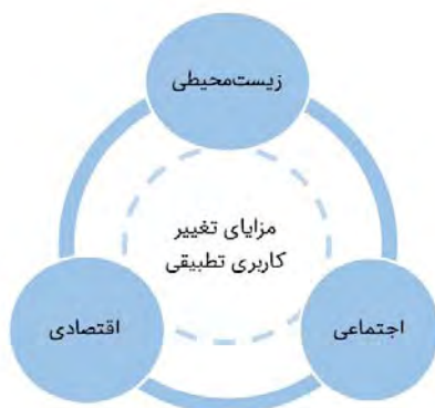
شکل ۲) مزایای تغییر کاربری تطبیقی میراث صنعتی (ترسیم: نویسندگان براساس مطالعه ویلسن [14])

تاریخی، حفاظت از هویت اصلی آنها است [11]. در بسیاری از جوامع کارخانه‌ها و بناهای صنعتی بخش حیاتی از هویت ساکنان آن هستند و به‌عنوان نشانه مهم محلی عمل می‌کنند [12]. درواقع از عملکرد جدید این بناها به‌عنوان تابعی برای تداوم عمر هویت شهری استفاده می‌شود [13]. برای استفاده مجدد از میراث صنعتی معیار و ضابطه تعیین می‌شود که بایستی به ارزش‌های ملموس و ناملموس آنها و همچنین شخصیت و هویت آنها توجه شود [15]. از جمله مزایای تغییر کاربری تطبیقی میراث صنعتی می‌توان به حفظ ارزش‌های بنا در سه جنبه زیست‌محیطی، اجتماعی و اقتصادی اشاره کرد (شکل ۲).