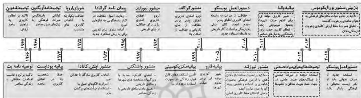
شکل ۱) سیر تحول اسناد و کنوانسیون‌های مرتبط با انطباق‌پذیری و استفاده مجدد میراث صنعتی با تاکید بر تداوم هویت شهری

تاریخی به‌عنوان موجودیتی زنده، به‌منظور ارتقای کیفیت حیات ساکنین و کیفیت محیطی در عین حفظ ارزش‌های فرهنگی تاکید شده است. در سال ۲۰۱۲ توصیه‌نامه تایپه برای میراث صنعتی آسیا استفاده مجدد از میراث صنعتی با عملکردهای جدید را عاملی در جهت حفظ هویت مناطق و کشورها می‌داند. در بازبینی منشور بورا ایکوموس (۲۰۱۳) بر تداوم حیات مکان‌های با اهمیت فرهنگی به‌عنوان شاهدهی بر تاریخ و هویت گذشته و نقطه پیوند جوامع معاصر با جوامع پیشین تاکید و عنوان شده است که انطباق باید با حداقل تغییر و با حفظ ارزش کالبدی و هویت فرهنگی مکان همراه باشد (شکل ۱).