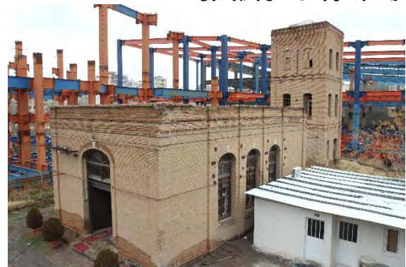
شکل ۴) مجموعه ساختمان‌های باقیمانده سالامبورسازی تبریز، احاطه‌شده توسط ساخت و سازهای پروژه هشت‌بهشت [23]

است و وجود قدرتمند این صنعت را در گذشته شهر در تولید چرم نشان می‌دهد. این موزه در سال ۱۹۵۴ افتتاح شده و در حال حاضر تنها موزه دباغی و چرم‌سازی در اسپانیا است. انتخاب کاربری موزه چرم برای این دو کارخانه که هویت شهر به این صنعت وابسته است، از بهترین نمونه‌های اعطای کاربری مجدد به بنا محسوب می‌شود و تاثیر به‌سزایی در سرزندگی بافت شهری و نمایش هویت و پیشینه شهر داشته است. اعطای کاربری مجدد در راستای کاربری اصلی بنا، باعث حفظ و تقویت تجربیات و خاطرات مردم ایگوالادا و تقویت حس تعلق به مکان شده است. دو عاملی که از عوامل تاثیرگذار در تداوم هویت شهری هستند. شاید هر کاربری دیگری به جز موزه نمی‌توانست تا این حد در سرزندگی و جذب گردشگر برای این منطقه صنعتی موفق عمل کند [24] .