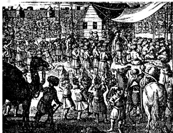
شکل ۳) مراسم عزاداری امام علی (ع) [12]