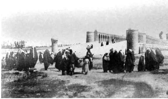
شکل ۵) پل الله‌وردی‌خان [25]