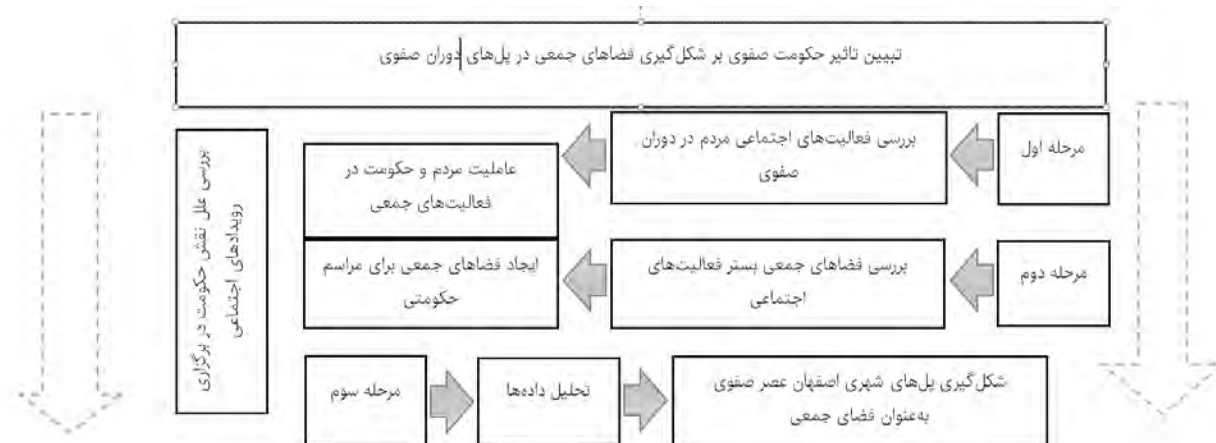
شکل ۱) مراحل انجام مطالعه

شکل ۲ مراسم قربانی کردن شتر در روز عید قربان و شکل ۳ مراسم