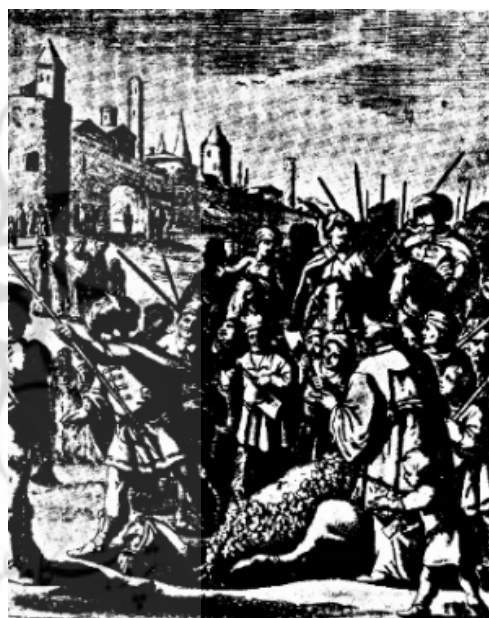
شکل ۲) مراسم قربانی کردن شتر در روز عید قربان [10]