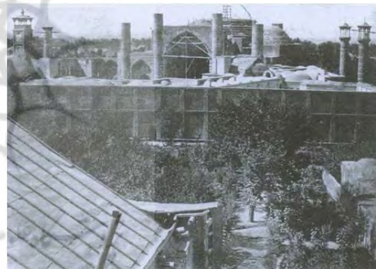
شکل ۵ باغ سپهسالار و مسجد در زمان ساخت در این عکس درهای شمالی که بعدها به‌علت ساخت کتابخانه مسدود شد، مشاهده می‌شود