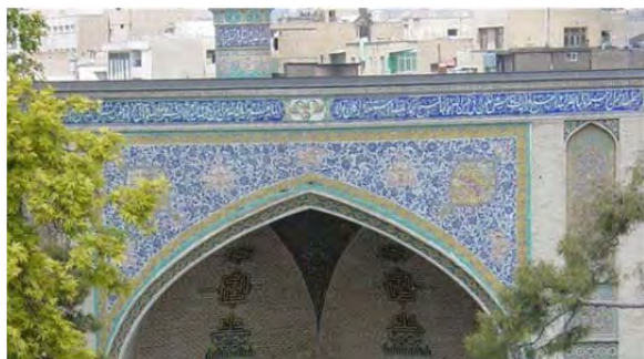
شکل ۱) کتیبه وقف‌نامه؛ ماخذ: نگارنده

۱) وقف‌نامه کاشی نوشته بالای طاق ایوان‌های طبقه یکم و روی چهاردیوار درونی صحن معروف به وقف‌نامه مختصر در کتیبه صحن مدرسه از قسمت بدنه راست جهت غربی شروع و به سمت بدنه چپ طرف غربی منتهی می‌شود [1] که توسط استاد غلامرضا کاشی‌کار نوشته شده است (شکل ۱).