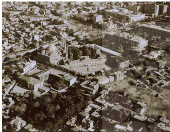
شکل ۳) دورنمای مسجد- مدرسه سپهسالار و محلات پیرامون آن در سال ۱۳۱۰؛ ماخذ: آرشیو داریوش تهامی

انبار آب: وقف است بر عامه مسلمین که از آن رفع حاجت نمایند (شکل ۳) [1].