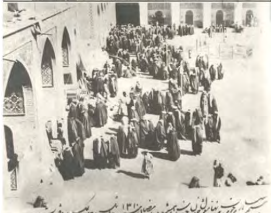
شکل ۲) تصاویر مختلف از مسجد سپهسالار در ایام ماه رمضان[21]

۳) سوم آن که مع‌الاسف تاکنون روی این وقفنامه به‌عنوان یک سند