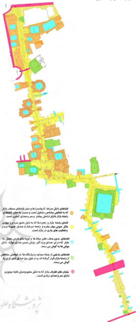
شکل ۷) حوزه‌های شنیداری بازار کاشان (نگارنده)

محدودیت مطالعه حاضر عدم وجود چارچوب نظری مدون در حوزه مطالعه ادراک فضا بود. پیشنهاد می‌شود پژوهشگران با زمینه‌های مطالعاتی ارایه‌شده در این پژوهش و مطالعه نمونه‌های مختلف، به اثبات وجود ادراک کامل فضایی در فضای معماری بومی ایران دست یابند تا بتوان با تدوین و ارایه نظریه بومی ادراک، تحلیل