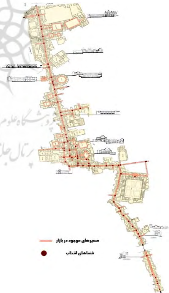
شکل ۴) مسیرها و فضاهایی که قدرت انتخاب فرد در بازار کاشان را نشان می‌دهند (نگارنده)