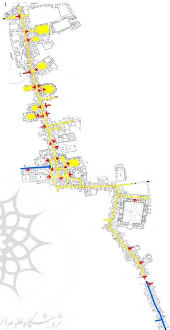
شکل ۸) فلش‌های آبی نشان‌دهنده محل اختلاف ارتفاع و فلش‌های قرمز نشان‌دهنده مسیر شیب‌دار در بازار هستند (نگارنده).

قابل کاربردی در فرآیند تحلیل فضاهای مختلف معاصر و تاریخی داشت.