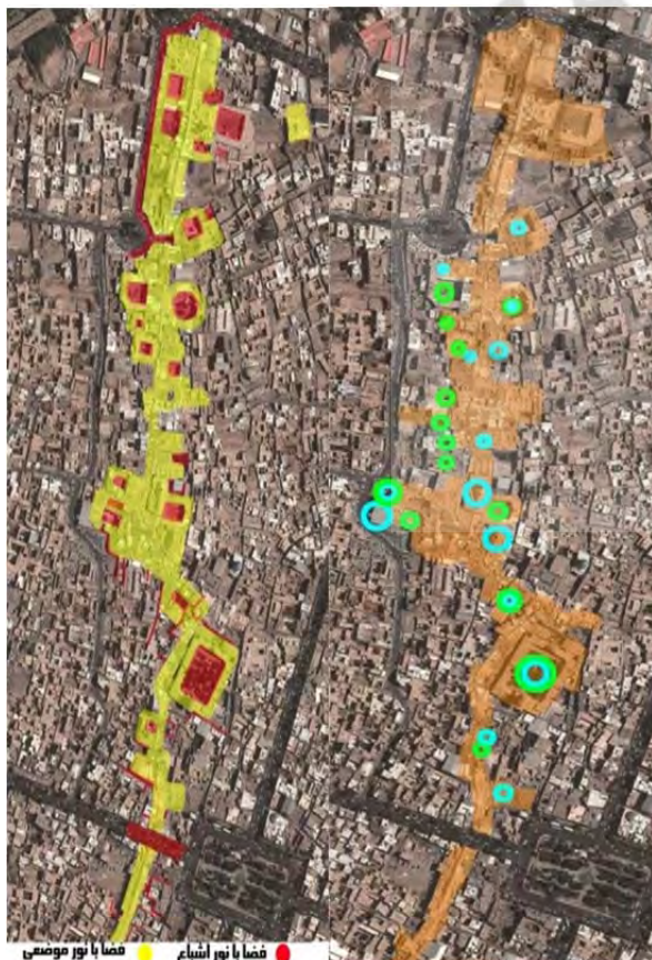
شکل ۵) در شکل سمت راست لکه‌های آبی‌رنگ نشان‌دهنده حضور آب و لکه‌های سبز نشان‌دهنده حضور گیاه در بازار است (نگارنده): در شکل سمت چپ نور موضعی و اشباع در بازار کاشان نشان داده شده است (نگارنده)

عناصر و مناظر طبیعی و مصنوعی: عناصر طبیعی مانند آب، باد، خاک، گیاه و نور به‌گونه‌ای هنرمندانه مورد استفاده قرار گرفته است. ایجاد تنوع رنگی در ترکیب گیاهان، آب و همین‌طور ترکیب بافت‌های مختلف قدرت بینایی را تشدید می‌کند. حضور نور در بازار در جهات و زوایای مختلف از مهم‌ترین عوامل زنده‌کردن و ایجاد پویایی در بازار است. پیدا و پنهان‌شدن نور در راستاهای افقی و عمودی محورهایی نامرئی در راستای افقی و عمودی ایجاد می‌کند (شکل ۵).