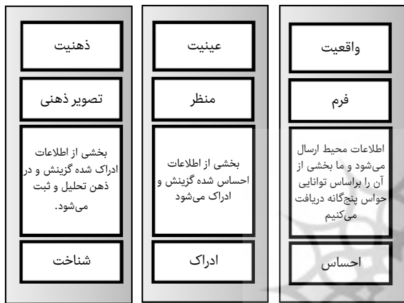
شکل ۱) مراحل احساس، ادراک و شناخت

خودشکوفایی دعوت نماید. از سویی دیگر تحلیل محیط براساس نظام‌های جهت‌دهنده و نظام ادراکی حواس پنج‌گانه می‌تواند نشان دهد که چگونه یک غنای حسی، معانی ازپیش‌آموخته و ازپیش‌تجربه‌شده را برای فرد تداعی کند که براساس نظریه تعادل اگر این معانی خوشایند باشند فرد ادراکی خوشایند و لذت‌بخش خواهد داشت و محیط را واجد زیبایی ارزیابی خواهد کرد، بنابراین با توجه به اهمیت نظام ادراکات حسی در ادراک فضایی معماری ایرانی براساس یافته‌های نظریه روان‌شناسی ادراک، نحوه ادراک فضایی معماری بازار سنتی بررسی شد تا علاوه بر بررسی نحوه رسیدن به ادراک مطلوب و غنای حسی از فضای معماری ایرانی، چگونگی ارتباط میان نظام‌های معنایی با نظام کالبدی نیز بررسی شود. بنابراین در پژوهش حاضر با اتکای تجربه به ادراک حسی، ارتباط انسان با محیط و معنای محیط، بازار کاشان به‌عنوان نمونه‌ای اصیل از بازارهای سنتی ایران مورد بررسی قرار گرفت.