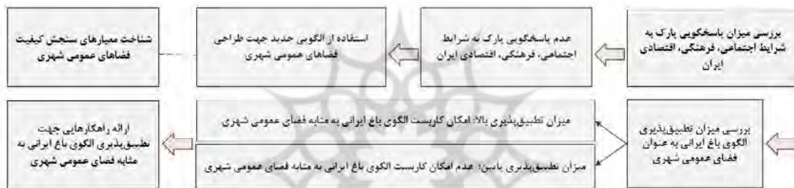
شکل ۱. مدل مفهومی روش تحقیق

در تحقیق پیش رو با هدف پاسخگویی به سؤالات مطرح شده، از مدل مفهومی مندرج در شکل ۱ استفاده شده است.