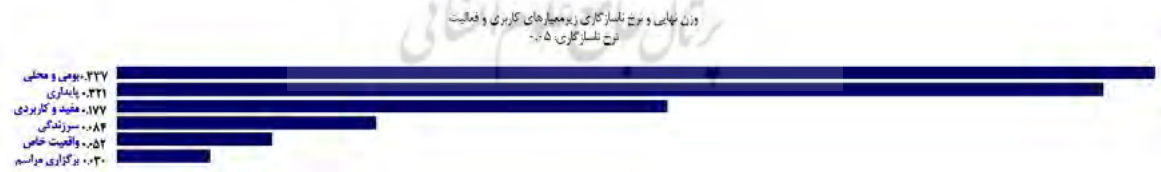
شکل ۵. وزن نهایی و نرخ ناسازگاری زیرمعیارهای کاربری و فعالیت

زیرمعیارهای این معیار، شامل پایداری، سرزندگی، بومی و محلی، مفید و کاربردی، واقعیت خاص، برگزاری مراسم است. شکل ۵ وزن نهایی این موارد را نشان می‌دهد. زیرمعیار بومی و محلی با وزن نهایی ۰,۳۳۷ بیشترین و زیرمعیار برگزاری مراسم با وزن نهایی ۰,۰۳۰ کمترین میزان تطبیق‌پذیری را به باغ ایرانی دارد. وزن نهایی سایر زیرمعیارها- که در محدوده ۰,۰۵۲-۰,۳۲۱ قرار می‌گیرد- میزان تطبیق‌پذیری آن‌ها را در باغ ایرانی نشان می‌دهد.