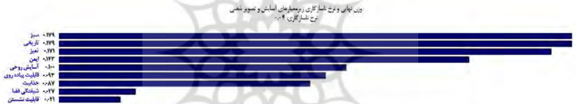
شکل ۴. وزن نهایی و نرخ ناسازگاری زیرمعیارهای آسایش و تصویر ذهنی

زیرمعیارهای آسایش و تصویر ذهنی شامل ایمنی، آسایش روحی، سبزی، تمیزی، شیفتگی، جذابیت، تاریخی، قابلیت پیاده‌روی، قابلیت نشستن است. با توجه به شکل ۴ زیرمعیار سبزی و تاریخی با داشتن وزن نهایی ۰,۱۷۹ در رتبه نخست و قابلیت نشستن با وزن ۰,۰۲۱ پایین‌ترین میزان تطبیق‌پذیری را در باغ ایرانی داراست. وزن نهایی سایر زیرمعیارها- که در محدوده ۰,۱۷۱-۰,۰۲۷ قرار می‌گیرد- میزان تطبیق‌پذیری هر کدام از آن‌ها را در باغ ایرانی نشان می‌دهد.