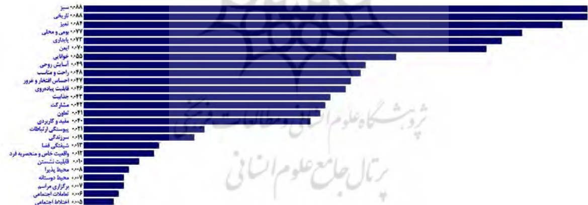
شکل ۸. وزن نهایی و نرخ ناسازگاری زیرمعیارها

مقایسه و بررسی زیرمعیارها نسبت به خط میانگین، شکل ۸ نشان می‌دهد از ۲۵ زیرمعیار بررسی شده در تحقیق، ۱۵ زیرمعیار بالاتر (۶۰٪) و ۱۰ زیرمعیار پایین‌تر از خط میانگین هستند که از این بین ۷۷٪ زیرمعیارهای بخش آسایش و تصویر ذهنی ۶۷٪ دسترسی و ارتباطات و ۵۰٪ کاربری و فعالیت و ۴۳٪ اجتماع‌پذیری بالاتر از خط میانگین قرار گرفته‌اند.