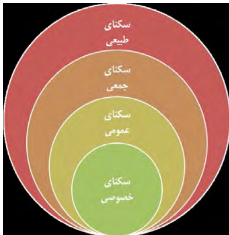
شکل ۱. سلسله‌مراتب تقسیم‌بندی فضای اگزستانس بر اساس اندیشه هاییدگر

به نام کیهان‌شناخت وجود داشت که تا حدودی در نقش جغرافیای امروز عمل می‌کرد.