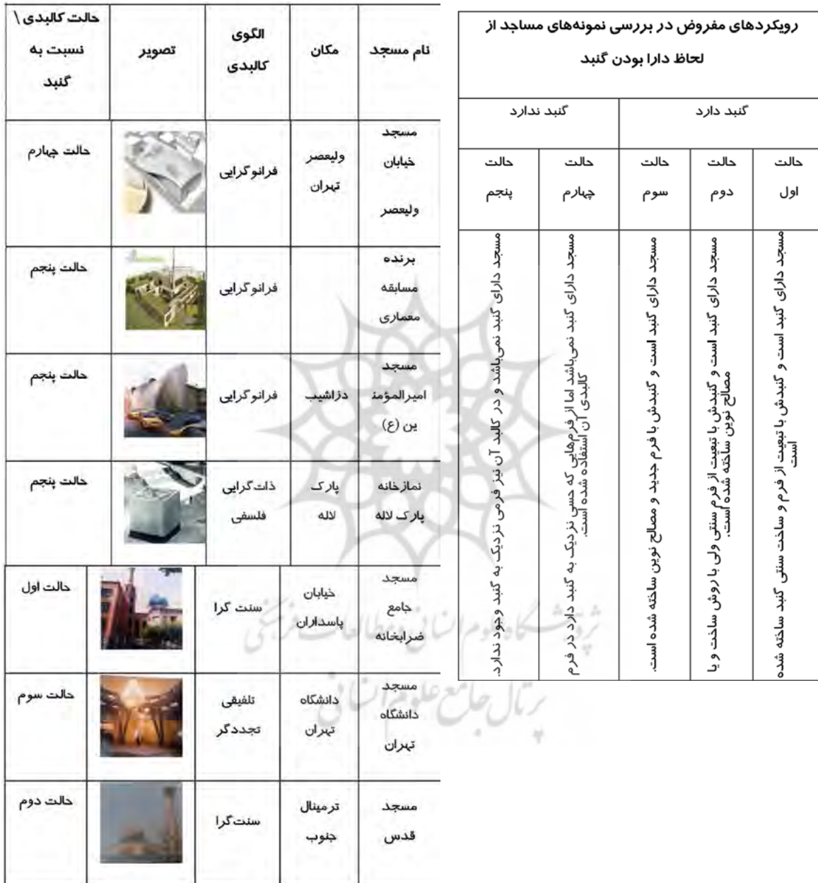
جدول ۲. بررسی نمونه‌های مساجد از لحاظ جایگاه گنبد