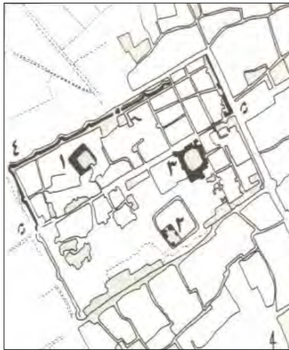
شکل شماره (۱) طیس: ۱. مسجد جامع ۲. ارگ، ۳. مدرسه ۴. بارو ۵. دروازه. (سلطان زاده، ۱۳۶۵: ۲۹۶)

در شهرهای خطی که شهر در حول یک محور ارتباطی شکل می گرفته، همانند سایر شهرها، مسجد در کنار عناصر دیگر در ساماندهی کالبدی شهر اهمیت داشته است.