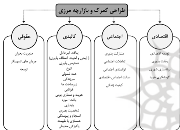
شکل ۳) مدل مفهومی طراحی گمرک و بازارچه مرزی

در نهایت در بعد کالبدی نیز اصولی مانند امنیت، اختلاط کاربری و طراحی مجتمع‌های سه‌منظوره زیستی- فعالیتی- دفاعی، نفوذپذیری و تسهیل در رفت‌وآمد، تامین زیرساخت‌های لازم برای توسعه، کیفیت عرصه همگانی، سرزندگی و سازگاری قرارگاه‌های رفتاری، طراحی مناطق مرزی به‌عنوان فضاهای واسط و ارتباط‌دهنده، هم‌پیوندی فضاها (کالبدی و غیرکالبدی) و تعامل مثبت بین آنها، رشد ساختار فضایی از طریق ارتقای خوانایی، آموزش‌پذیری (گسترش دانش تخصصی و آموزش عمومی و فرهنگی بین مردم)، استفاده از ساختار فضایی و عوارض جغرافیایی برای دفاع، طراحی محیطی و توجه به زمینه را در طراحی لازم می‌داند [2]. به علاوه این پژوهش پدافند غیرعامل را از طریق تامین ایمنی و امنیت، انعطاف‌پذیری فضا و همه‌شمولی را همراه با تاکید بر حس مکان، با دخیل‌دانستن معماری بومی، شخصیت بصری و هویت مکانی را در امر طراحی لازم می‌داند.