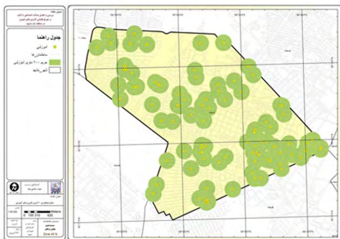
نقشه ۵- شعاع عملکرد کاربری‌های آموزشی منطقه ۱ شهرداری مشهد، ۱۳۹۳