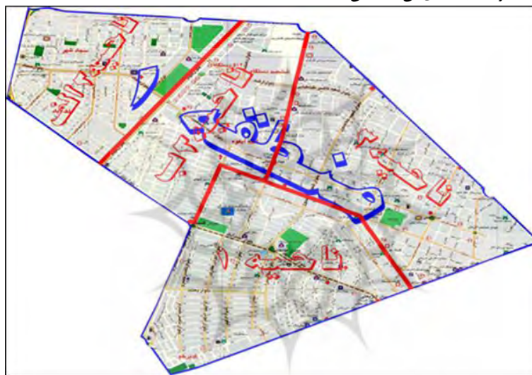
نقشه ۱- موقعیت جغرافیایی منطقه مورد مطالعه

منطقه ۱ شهرداری مشهد با وسعتی معادل ۱۶۱۱ هکتار از سه ناحیه خدماتی تشکیل شده است. این منطقه به لحاظ مرکزیت شهری از نظر تجاری، اداری، جمعیت و ترافیک بیش از اندازه‌ای را در خود جای داده و از شمال به میدان استقلال، جنوب به میدان فلسطین، شرق به خیابان دانشگاه و از غرب به میدان آزادی متصل می‌گردد. در نقشه ذیل موقعیت مکانی و راه‌های دسترسی این منطقه به همراه ناحیه بندی آن مشخص شده است.