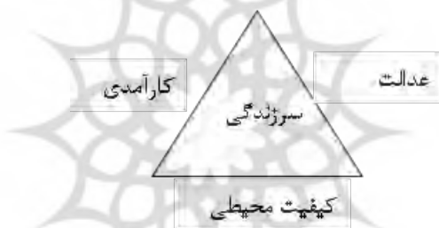
شکل ۱- بررسی رابطه سرزندگی با سایر عناصر

اصول بنیادی شهرسازی در چهار مقوله اساسی (عدالت، کارآیی، کیفیت محیطی و سرزندگی) است.