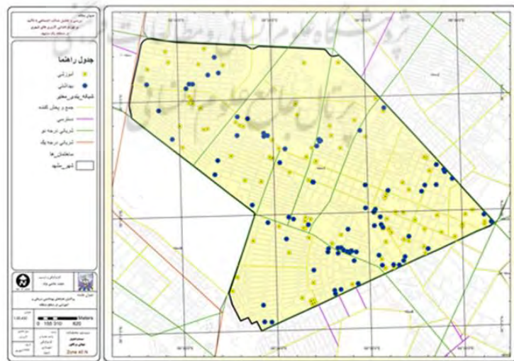
نقشه ۴- پراکنش کاربری‌های بهداشتی-درمانی و آموزشی منطقه ۱ شهرداری مشهد، ۱۳۹۳