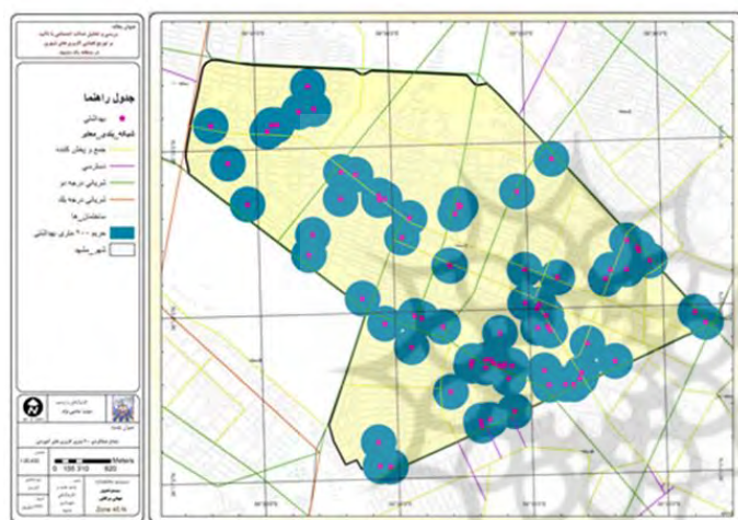
نقشه ۶- شعاع عملکرد کاربری‌های بهداشتی-درمانی منطقه ۱ شهرداری مشهد، ۱۳۹۳

با توجه به شعاع دسترسی ۲۰۰ متری برای کاربری‌های آموزشی سطح منطقه و تعیین مناطق دارای خلا خدماتی در نقشه فوق، مشخص گردید که بخش های شمالی و مرکزی به سمت شرق و جنوبی منطقه دارای خلا های خدماتی و فاقد دسترسی مناسب به خدمات مذکور هستند و این در حالی است که قسمت های شرقی و مرکزی منطقه از تراکم بیش از حدی از خدمات مذکور برخوردار هستند که بیش از نیاز موجود است.