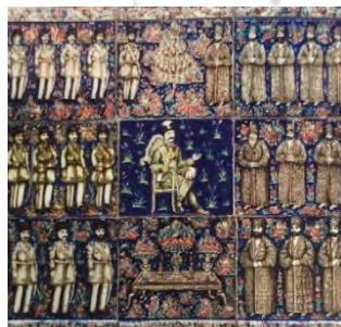
تصویر ۱۲- تالار آینه، صحنه سلام (ریاضی، ۱۳۹۵، ۱۹۹)