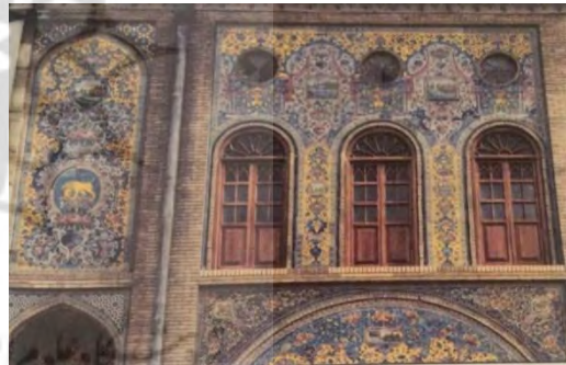
تصویر ۷- ایوان بیرونی تخت مرمر (گودرزی، ۱۳۸۸) تصویر ۸- ایوان بیرونی تخت مرمر (گودرزی، ۱۳۸۸)