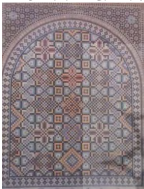
تصویر ۴- عمارت بادگیر (گودرزی، ۱۳۸۸)