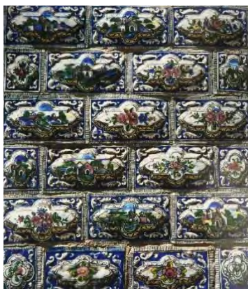
تصویر ۱۰- تالار ظروف، کاشی نقش برجسته (ریاضی، ۱۳۹۵)

تصویر ۱۰ نمای بیرونی این تالار را با کاشی‌های برجسته، نشان می‌دهد. در متن کاشی‌ها، قاب‌هایی هشت ضلعی و چهار ضلعی طراحی و صحنه‌های معماری و گل و بوته نقاشی شده و حاشیه‌های آن‌ها با پیچک‌های اسلیمی تزیین شده است. (ریاضی، ۱۳۹۵، ۱۹۸)