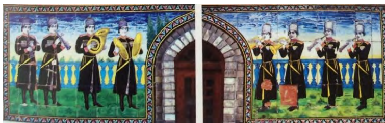
تصویر ۵- شمس العماره، صف نوازندگان (ریاضی، ۱۳۹۵)

شمس العماره یکی از بناهای مرتفع و شاخص تهران قدیم است. ناصرالدین شاه پس از سفر اروپا تمایل پیدا کرد که ساختمان بلندی نظیر بناهای فرنگ در پایتخت خود بسازد تا از بالای آن خود و زنانش بتوانند منظره شهر و دورنمای اطراف را تماشا کنند. در تصویر ۵ بخشی از تزئینات طرفین یک درب در کاخ شمس العماره نشان داده شده است. داخل فرم بیضی شکل صحنه افسانه‌ای با فیگور و عناصر انسانی کار شده است. (تلخیص، همان، ۱۸۱) تصویر ۶ صفی از عوامل و نیروهای تشریفاتی مربوط به دوره قاجار را نشان می‌دهد که ضمن ارائه لباس و تزئینات مربوط به این افراد، از طرفی گرایشی ظاهراً طبیعت‌گرایانه و از طرف دیگر با فضای خیالی نیز ارتباطی جدی دارند. به جز آسمان که با یک نوانس از کمرنگی به پرننگی حرکت می‌کند، بقیه عناصر نه آنچنان مادی و جسمی محض و نه آنچنان غیرمادی و غیرمتجسد می‌باشند. (همان، ۱۹۵) بعضی از قسمت‌های این کاشی‌کاری در گذشته دچار ریختگی شده بودند که در دوره پهلوی دوباره‌سازی و نصب شدند. (ریاضی، ۱۳۹۵، ۱۹۳)