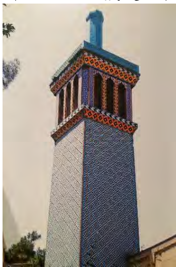
تصویر ۲- برج بادگیر (ریاضی، ۱۳۹۵)

همچنین نقوش دیگری به رنگ‌های بسیار ملایم، به عنوان ختایی‌های مکمل در لابه‌لای ایم اسلیمی‌ها قرار دارند. در تصویر ۴ نمونه بارزی از تنوع و در عین حال هماهنگی را در نقوش هندسی می‌توان دید. (تلخیص، گودرزی، ۱۳۸۸، ۱۹۹-۲۰۲)