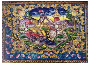
تصویر ۶- نبرد رستم و دیو سفید (ریاضی، ۱۳۹۵، ۱۹۶)