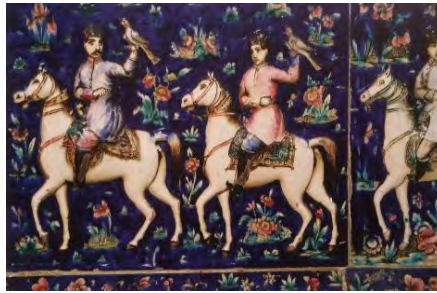
تصویر ۱۳- تالار آینه (ریاضی، ۱۳۹۵)