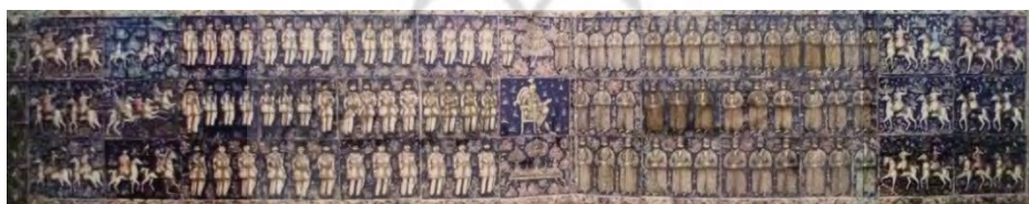
تصویر ۱۱- تالار آینه، کاشی هفت رنگ نقش برجسته (ریاضی، ۱۳۹۵، ۲۰۰)

کاشی‌های این سرسرا بسیار زیبا و در نوع خور بی‌نظیر است و در شمار بهترین کاشی‌های مصور دوره قاجار هستند. اندازه این کاشی‌ها متفاوت بوده و اغلب دارای نقوش برجسته می‌باشند. رنگ غالب در آن‌ها آبی لاجوردی است. در تصاویر ۱۱ و ۱۲ در مرکز سرسرای مجلس بار عام، ناصرالدین شاه روی سه ردیف کاشی بازنمایی شده و شاه در مرکز این مجلس روی صندلی نشسته است. در سمت راست او دولتمردان قاجاری در حالی که دست‌های خود را به هم مشت کرده‌اند به حالت خبردار و احترام ایستاده‌اند. در سمت چپ نیز شخصیت‌های نظامی که احتمالاً نمایندگان دولت‌های خارجی هستند، به صف ایستاده‌اند. در دو سوی این مجلس همانطور که در تصویر شماره ۱۳ مشخص است، سوارکارانی در حالیکه بازهای شکاری در دست دارند به مرکز صحنه نزدیک می‌شوند. در یک تک کاشی (تصویر شماره ۱۴) لحظه تیراندازی ناصرالدین شاه نشان داده شده که شباهت زیادی به صحنه شکار گراز خسرو پرویز در طاق بستان دارد. (تلخیص، همان، ۱۹۹-۲۰۱)