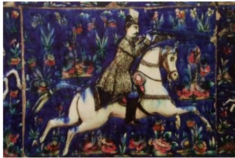
تصویر ۱۴- تالار آینه، ناصرالدین شاه در حال شکار (ریاضی، ۱۳۹۵)