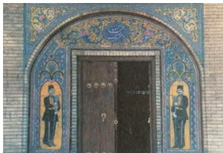
تصویر ۱- عمارت بادگیر (گودرزی، ۱۳۸۸)