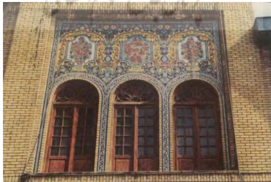
تصویر ۹- ایوان بیرونی تخت مرمر (گودرزی، ۱۳۸۸)