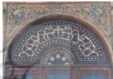
تصویر ۳- عمارت بادگیر (گودرزی، ۱۳۸۸)