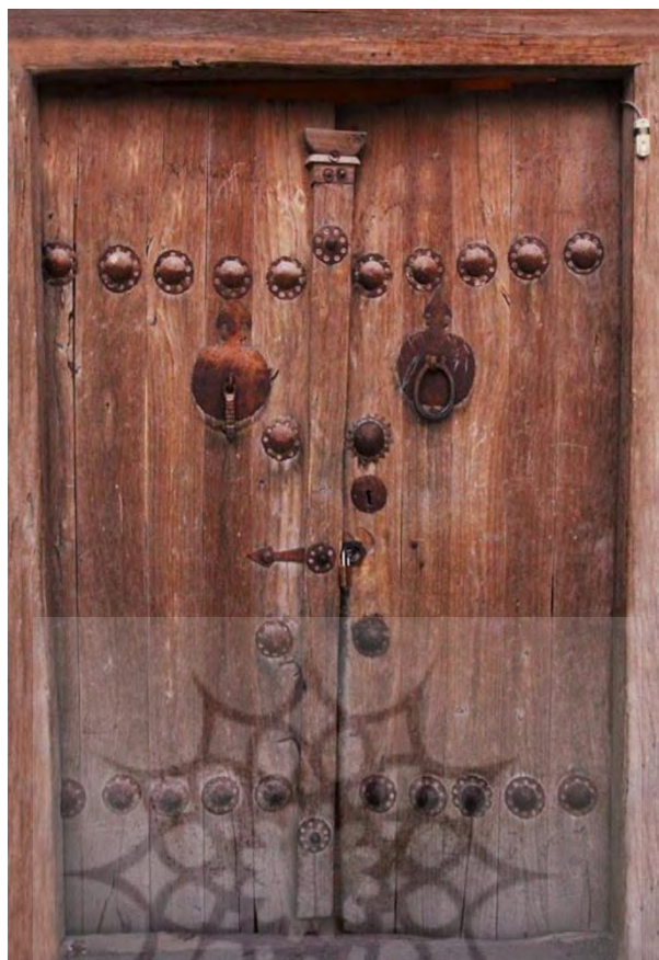
تصویر ۵، (باقری، ۱۳۹۷: ۶۲)

این که با وجود گذشت زمان و در برابر عوامل فرسایشی و مخرب بسیار مقاوم هستند. علاوه بر چوب، از فلزات مختلف نیز برای ساخت تمام یا قسمتی از در استفاده شده است.