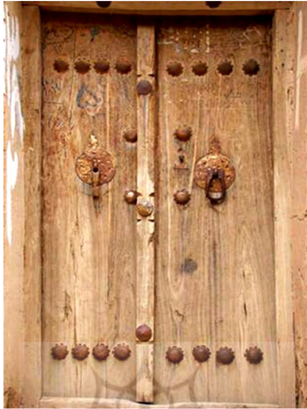
تصویر ۱، (باقری، ۱۳۹۷: ۱۹)