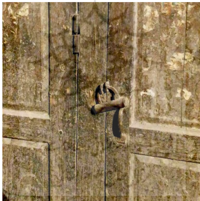
تصویر ۸، (باقری، ۱۳۹۷: ۹۵)

قفل، قطعه چوب ضخیمی است که با گلمیخ‌هایی به پشت لنگه در وصل شده و درون آن به اندازه کلون سوراخ شده است. ساخت قفل‌های مطمئن نیز ضروری بود. درودگرانی که قفل درها را می‌سازند یا نصب می‌کنند، باید در محافظت از املاک و دارایی‌های مردم بسیار دقت کنند و مجاز نیستند دو کلید یکسان برای دو شخص مختلف بسازند. کاروان‌سراهای بیابانی نیز، برای نظارت بیشتر، فقط یک در داشتند (سلطان زاده، ۱۳۷۲: ۴۸).