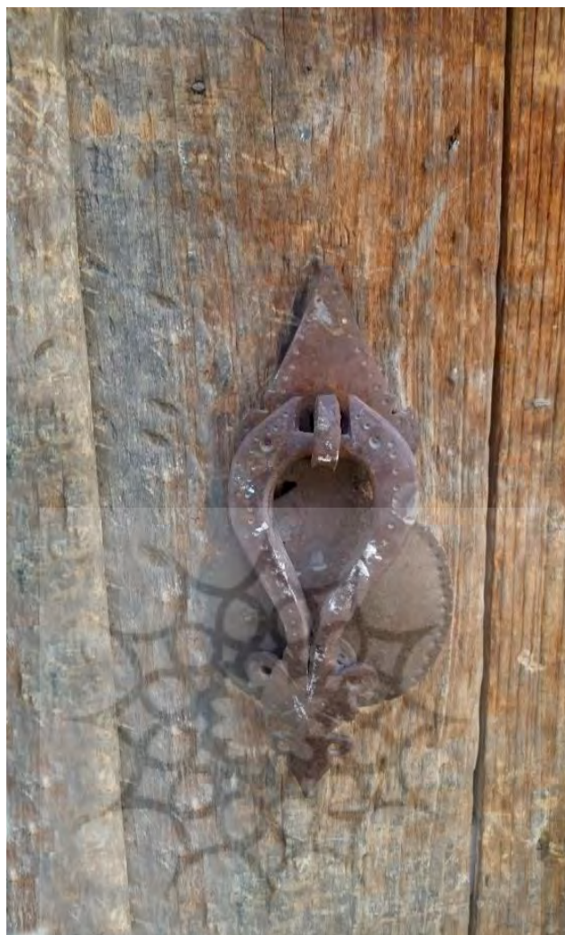
تصویر ۷، (باقری، ۱۳۹۷: ۸۹)

نقره کوب شده است. کوبه‌های خانم‌ها از تزئینات بیشتری مانند نقوش سیب، قلب، سر ترنج استفاده می‌شده و کوبه‌های آقایان فاقد تزئینات زیاد بوده است.