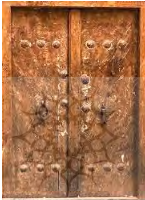
تصویر ۴، (باقری، ۱۳۹۷: ۵۰)

درها با توجه به محلّ قرار گرفتن موقعیت بنا، تعداد، اندازه، تزیینات و... نام‌های مختلفی داشتند. برای نمونه به در اصلی خانه «درِ سر»، به درِ کوچک و یک لنگه میان هشتی و دالان، «میان‌در» (پیرنیا، ۱۳۷۱: ۳۵۰)، به درهای مشبک، «در و پنجره» و به ترکیب در و پنجره که در قسمت پایین آن در و در قسمت بالای آن پنجره قرار دارد، «پاچلاقی» گفته می‌شود (امرابی، ۱۳۸۳: ۲۸). همچنین در شهرها و روستاها، برای جلوگیری از تعدّی زورمندان و جلب نکردن توجه آن‌ها، درهای ورودی را ساده می‌ساختند.