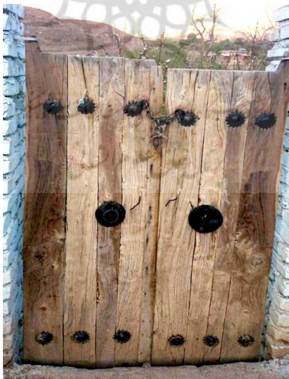
تصویر ۲ (باقری، ۱۳۹۷: ۲۲)

و [یعقوب خطاب به فرزندان‌ش] گفت: ای پسران من، همگی از یک در وارد نشوید و از درهای گوناگون وارد شوید، و من هرگز از شما چیزی را که از سوی خداست دفع نتوانم کرد. فرمان نافذ و حکومت جز برای خدا نیست، بر او توکل کردم و توکل کنندگان تنها باید بر او توکل کنند.