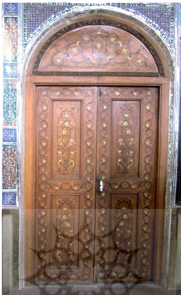
تصویر ۶، (باقری، ۱۳۹۷: ۶۳)