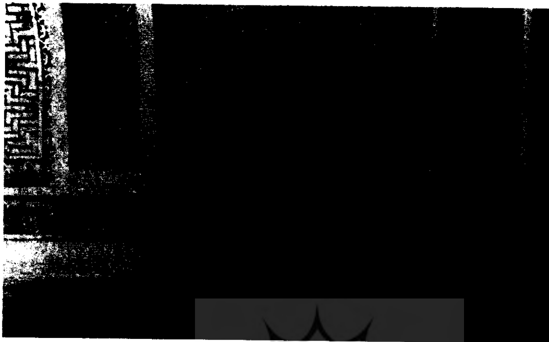
۳. مسجد جامع هرات، کنیبه دوره غوریان در ایوان شبستان

یا مسجد جامع هرات را، که باید استثنایی بوده باشد، ندارد.