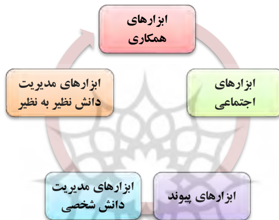
شکل (۱): دسته‌بندی ابزارهای مدیریت دانش برای اثربخشی یادگیری الکترونیکی

اگر فرایندهای مدیریت دانش و ابزارهای آن در فرایند یادگیری الکترونیکی به کار رود و ادغام شود، می‌تواند فراگیران را قادر به شناسایی محتوای مهم دانشی برای یادگیری نموده و مسیر به کاربرد رساندن آن را ترسیم نماید. از جنبه مدیریت دانش، فراگیران جهت کسب دانش باید فرآیندهای مدیریت دانش شامل خلق، اکتساب، ذخیره‌سازی، شخصی‌سازی، تسهیم، توزیع، همکاری و به کارگیری دانش را دنبال نمایند. به طور کلی ابزارهای مدیریت دانش را می‌توان به پنج دسته زیر طبقه‌بندی نمود ( Tsui & Lau, 2009; Yan & etal., 2008; Wang & etal., 2007):