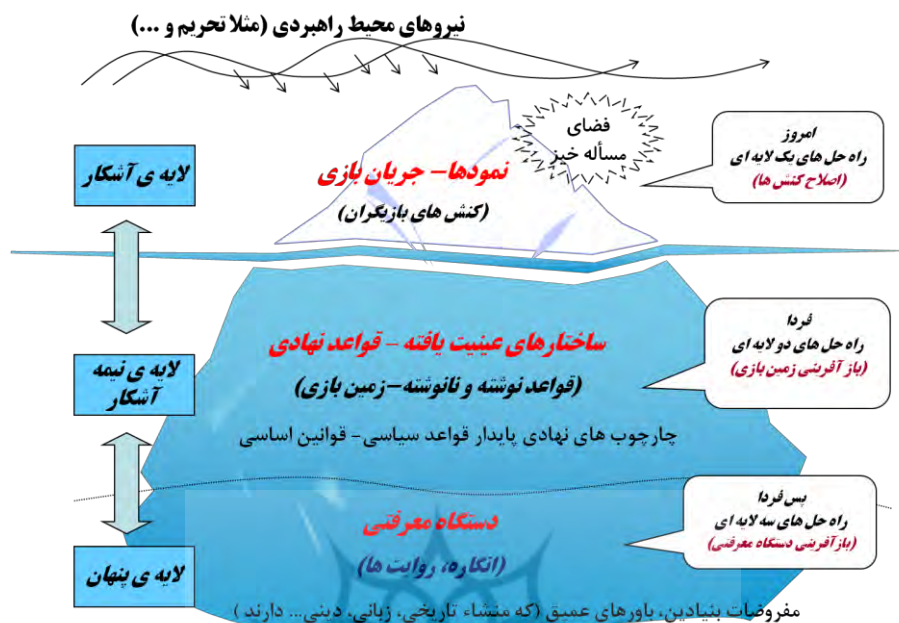
شکل ۱. الگوی تحلیل سه‌لایه‌ای، ابزاری برای خودفهمی (فرتوک‌زاده و وزیری، ۱۳۹۴)