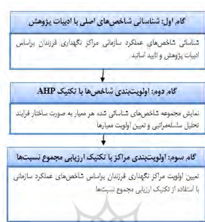
شکل ۱. الگوریتم اجرای پژوهش

بنابراین، دایره انتخاب خبرگان بسیار محدود است و در نتیجه تعداد ۲۰ نفر از افراد واجد شرایط به‌عنوان نمونه مورد بررسی در این مطالعه انتخاب شده‌اند. همان‌طور که عنوان شد، پرسشنامه اصلی مورد استفاده پرسشنامه خبره است. جهت ارزیابی مراکز نگهداری کودکان در روش ARAS از دیدگاه کارشناسان سازمان بهزیستی استفاده شده است. ده نفر از کارشناسان این سازمان بر اساس دو قید تجربه (بالای ده سال سابقه کاری و تحصیلات (حداقل مدرک کارشناسی ارشد) از سازمان بهزیستی انتخاب شده‌اند. نمونه‌گیری به روش غیراحتمالی و هدفمند انجام شده است. پرسشنامه خبره جهت اولویت‌بندی معیارهای اصلی تحقیق با استفاده از تکنیک‌های مبتنی بر مقایسه زوجی مورد استفاده یعنی AHP و ARAS است. این پرسشنامه‌ها براساس طیف ۹ درجه ساعتی تنظیم شده است.