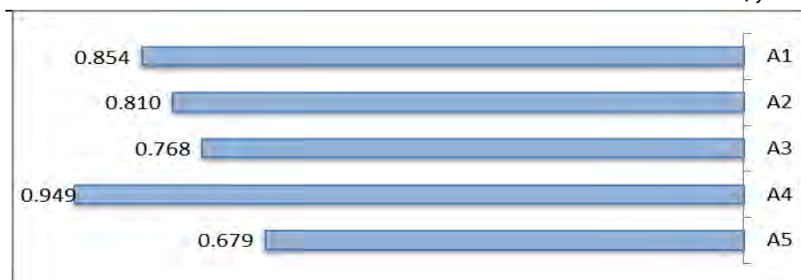
شکل ۳. وضعیت اولویت هریک از گزینه‌ها