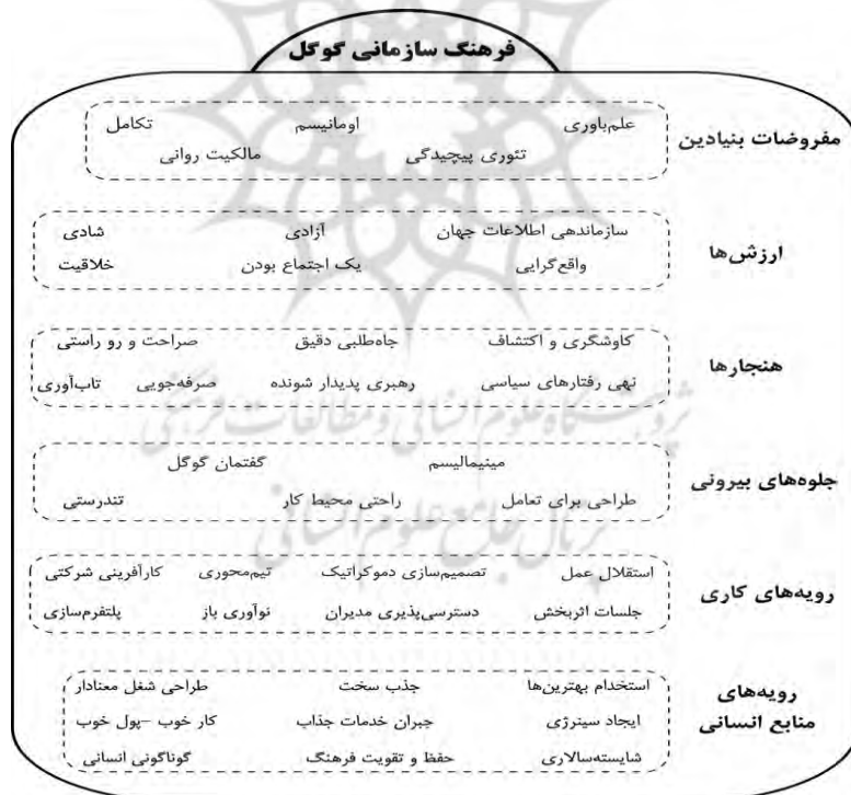
نمودار ۱. مدل نگاشت میمیتیک گوگل

برای تحلیل داده‌های گردآوری‌شده از روش تحلیل تماتیک استفاده شد. کدهای اولیه (میم‌ها) در قالب چهل مقوله (میمکول) دسته‌بندی شدند و در شش سطح فرهنگی قرار گرفتند. حاصل آن مدل نگاشت میمیتیک است که در نمودار ۱ مشاهده می‌شود. این مدل مانند یک عکس فوری است و فرهنگ سازمانی گوگل را در حال حاضر و در یک نگاه نشان می‌دهد (Guo et al 2017: 332).