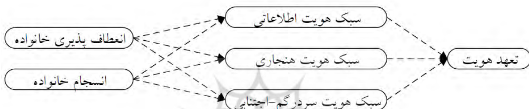
شکل (۱): دیاگرام مسیرهای اولیه متغیرهای پژوهش

تحقیق جعفری (۱۳۹۱) نشان داد که رابطه معناداری بین کارائی خانواده و سبک‌های هویتی وجود ندارد. نتایج پژوهش رحیمی نژاد و همکاران (۱۳۹۱) نشان داد که سبک‌های هویت اطلاعاتی و هنجاری دارای اثر مستقیم و مثبت و سبک هویت سردرگم-اجتنابی دارای اثر مستقیم و منفی و معنادار بر تعهد هویت است. در پژوهش فرتاش (۱۳۹۳)، نتایج نشان داد که بین بافت خانواده و متغیرهای هویتی نوجوانان تعامل پیچیده‌ای وجود دارد. پژوهش حاضر پژوهش حاضر بررسی مدلی علی از انعطاف‌پذیری و انسجام خانواده و تعهد هویت با واسطه‌گری سبک‌های هویت می‌باشد. دیاگرام مسیرهای اولیه در شکل (۱) قابل مشاهده می‌باشد: