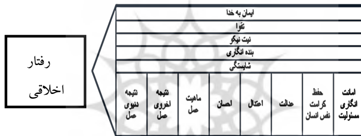
شکل ۲. الگوی پیشنهادی برای ارزیابی رفتار اخلاقی در سازمان‌های ایرانی

بر اساس نتایج پژوهش، مدل شکل ۲ به عنوان الگوی ارزیابی رفتار اخلاقی در سازمان‌های ایرانی پیشنهاد می‌شود. در این الگو، معیارها به صورت یکپارچه در نظر گرفته شده‌اند و مضامین حسن فاعلی در عرض مضامین حسن فعلی قرار می‌گیرند. این بدان معناست که هر یک از معیارهای حسن فاعلی باید همواره و در هر مرحله از ارزیابی حسن فعلی، مدنظر باشد. درباره ارزیابی رفتار از بعد حسن فعلی می‌توان به صورت مرحله‌ای و گام‌به‌گام پیش رفت؛ در ادامه هر یک از معیارها تشریح شده است: