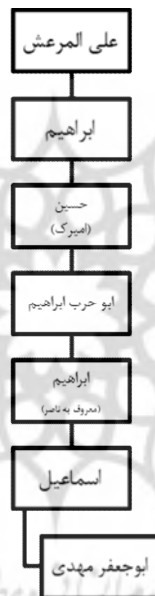
نمودار ۱. نسب ابوجعفر

مهدی بن ابی حرب الحسینی المرعشی رضی الله عنه". بیش از این در الاحتجاج، و یا دیگر آثار موجود از طبرسی، نامی از ابوجعفر حسینی مرعشی نیامده است. سمعانی در مدخل "المرعشی" ابوجعفر مرعشی را معرفی کرده و نوشته است: «و مرعش» اسم علوی، انتسب إليه أبو جعفر المهدی بن إسماعیل ابن إبراهيم، و هو يعرف بناصر بن أبي حرب إبراهيم بن الحسين، و هو يعرف بأمیرک بن إبراهيم بن علی - و هو المرعش - بن عبدالله بن الحسن ابن الحسين بن علی بن الحسن بن علی بن أبي طالب العلوی المرعشی، يعرف بناصر الدین». بر اساس نوشته سمعانی می‌توان نمودار زیر را در نسب ابوجعفر تا علی المرعش ترسیم نمود: