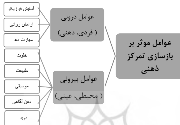
تصویر ۱- عوامل موثر بر بازسازی تمرکز ذهنی دانش آموزان، ماخذ: نگارندگان

بررسی مطالعات پیشین در زمینه عوامل موثر بر بازسازی تمرکز ذهنی دانش آموزان، محقق را بر آن داشت تا این عوامل را مطابق تصویر شماره ۱ دسته بندی نماید.