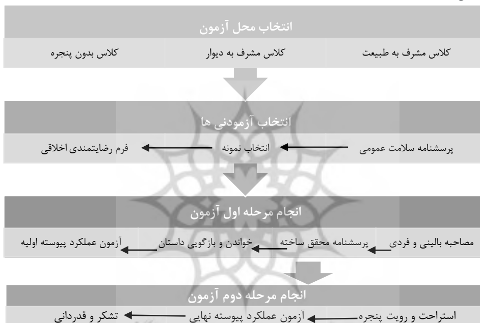
تصویر ۳- مراحل انجام آزمون

پس از انجام آزمون دوم از آزمودنی تشکر و به پاس سپاسگزاری از شرکت وی در آزمون هدیه ای به وی تقدیم شد. در تصویر شماره ۳ مراحل انجام آزمون از زمان انتخاب مکان تا پایان آزمون نمایش داده شده است.