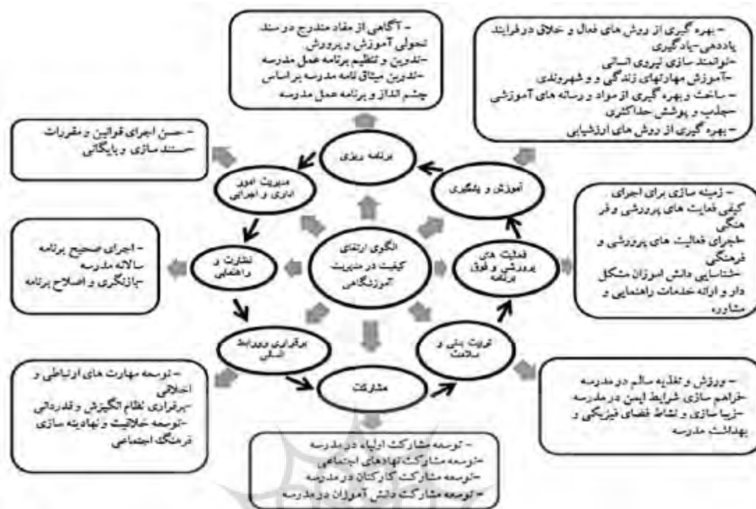
نمودار 1. الگوی نهایی ارتقای کیفیت مدیریت آموزشگاهی در مدارس ابتدایی استان زنجان