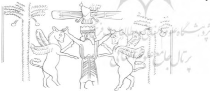
تصویر ۵: نقش انسان بالدار. (Allen, 2005: 123)