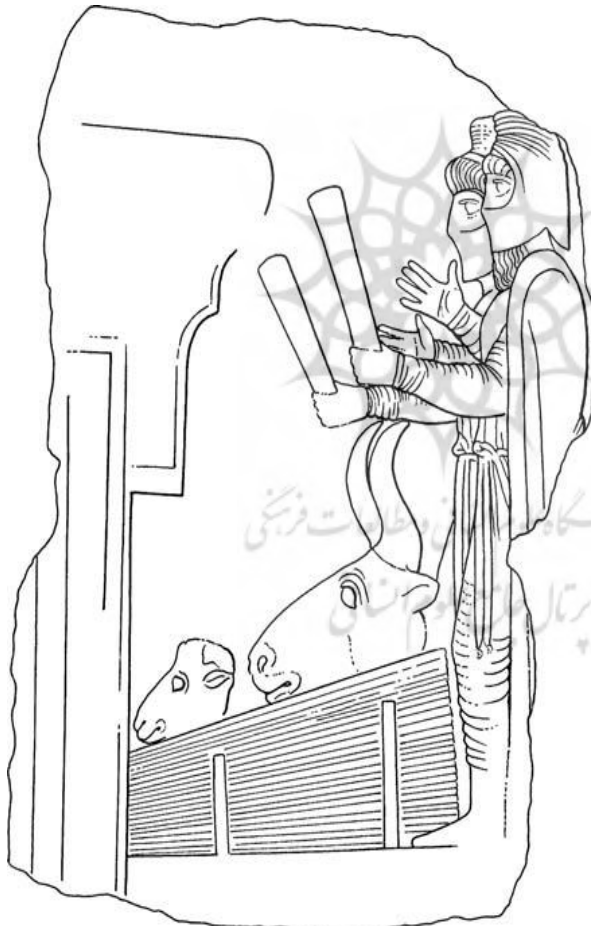
تصویر ۲: مغان برسم به دست

۶- ایرانیان در عهد هخامنشی، شیرهی گیاهی موسوم به «هوم» ۴۸ را در مراسم مذهبی استعمال می‌کردند که همان سومای هندیان است؛ ولی زرتشت در یسنا ۱۴-۳۲ پیروان