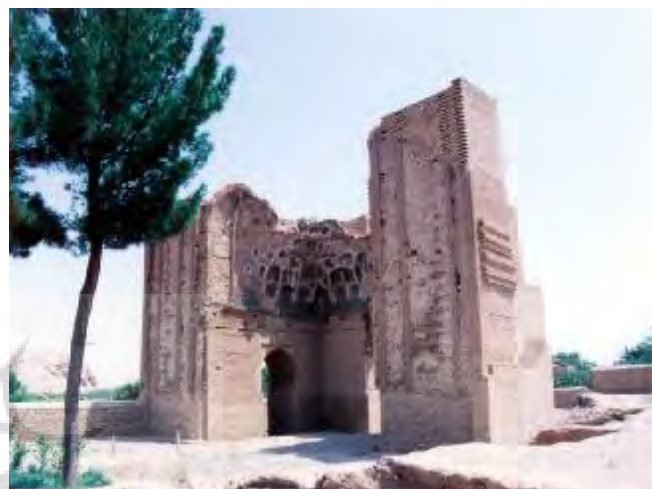
دو ایوان باقیمانده از مسجد ملک زوزن