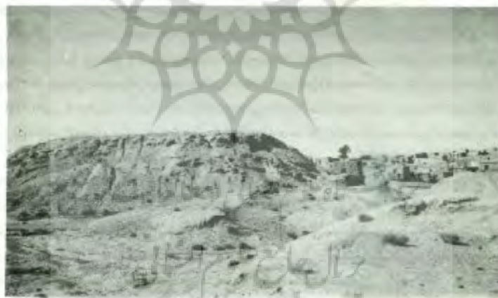
خرابه‌های قلعه فاهره دوزوزن