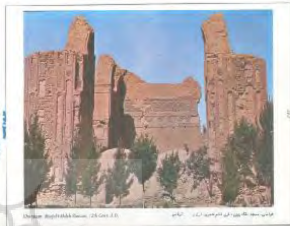
نمای دیگری از ایوانهای مسجد