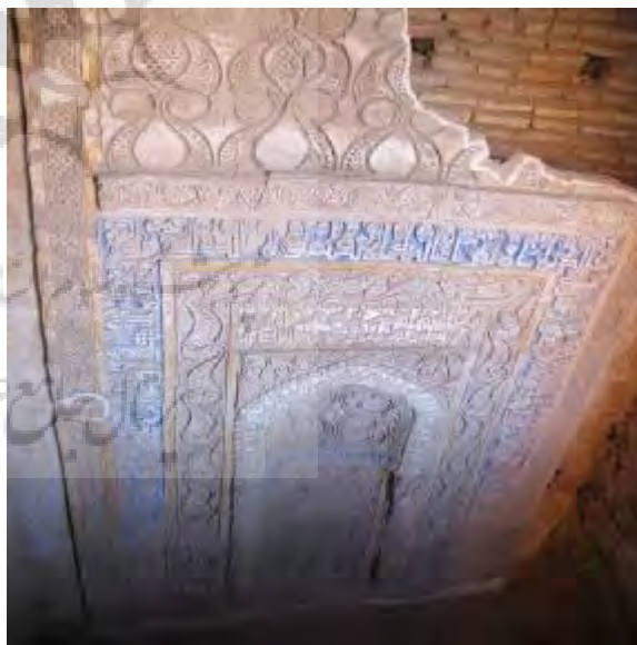
نمونه ای از تزئینات و محراب نفیس مسجد زوزن