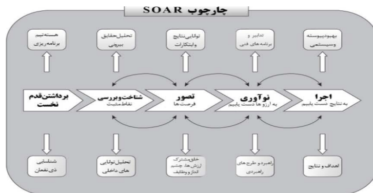
تصویر ۳. چهارچوب مدل.