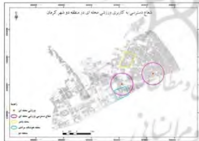
شکل ۷- شعاع عملکرد کاربری ورزشی محله‌ای در منطقه دو