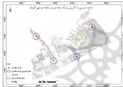
شکل ۵- شعاع عملکرد کاربری پارک محله‌ای در منطقه دو