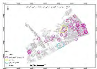
شکل (۹) شعاع عملکرد کاربری مذهبی در منطقه دو