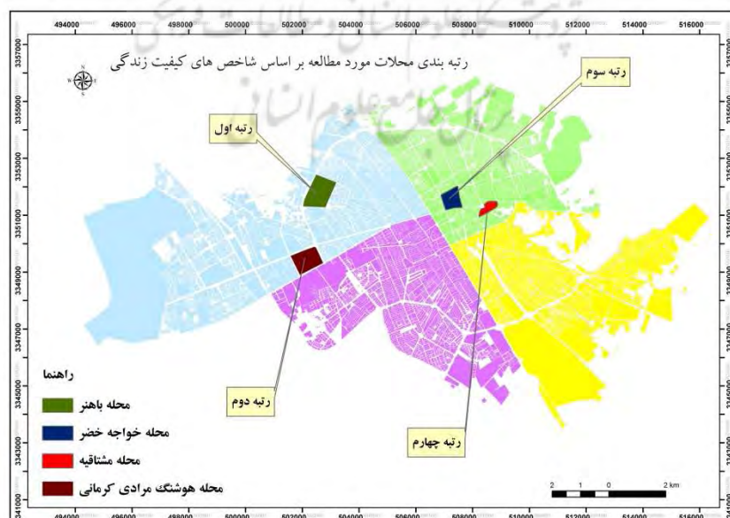
شکل ۱۹- رتبه‌بندی محلات مورد مطالعه بر اساس مدل AHP