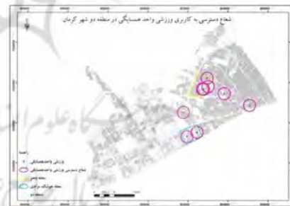
شکل ۶- شعاع عملکرد کاربری ورزشی واحد همسایگی در منطقه دو