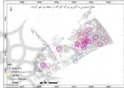
شکل ۴- شعاع عملکرد کاربری پارک کودک در منطقه دو