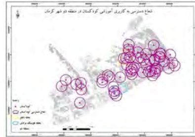
شکل ۲- شعاع عملکرد کاربری کودکستان در منطقه دو