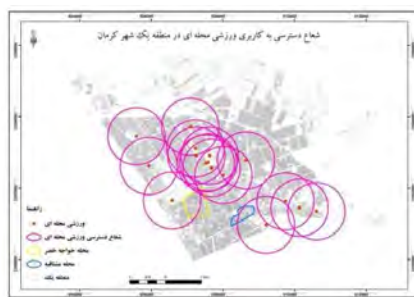
شکل ۱۵- شعاع عملکرد کاربری ورزشی محله‌ای در منطقه یک