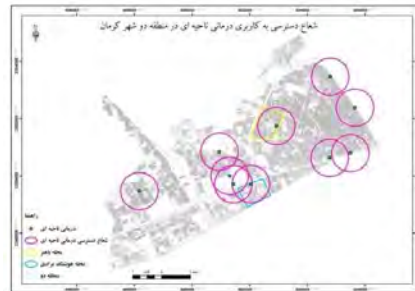
شکل (۸) شعاع عملکرد کاربری درمانی ناحیه‌ای در منطقه دو