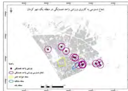
شکل ۱۴- شعاع عملکرد کاربری ورزشی واحد همسایگی در منطقه یک