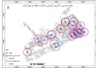
شکل ۳- شعاع عملکرد کاربری دهبستان در منطقه دو

کاربری مذهبی: کاربری مذهبی دارای شعاع عملکرد ۲۰۰ متر مربع بیش از ۵۰ درصد منطقه دو شهری کرمان به خصوص نواحی مرکزی این منطقه به طور کامل تحت پوشش قرار داده است، اما در محله هوشنگ مرادی کرمانی کاربری مذهبی وجود ندارد؛ همچنین محله باهنر نیز بطور کامل پوشش داده نشده است.