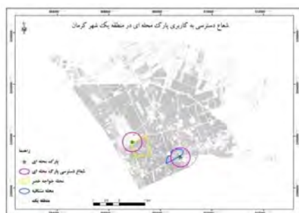
شکل ۱۳- شعاع عملکرد کاربری پارک محله‌ای در منطقه یک