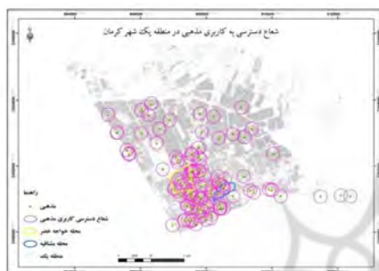
شکل ۱۷- شعاع عملکرد کاربری مذهبی در منطقه یک