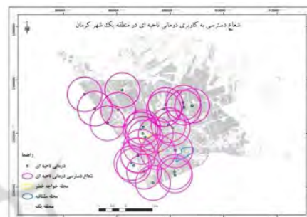
شکل ۱۶- شعاع عملکرد کاربری درمانی ناحیه‌ای در منطقه یک