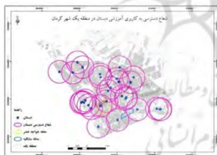
شکل ۱۱- شعاع عملکرد کاربری دبستان در منطقه یک

-کودکستان: کاربری کودکستان دارای شعاع عملکردی ۴۰۰ متر می باشد. طبق مطالعات و شکل (۱۰) این کاربری تمامی محله خواجه خضر را در بر گرفته است و اما محله هوشنگ مرادی کرمانی را اصلا پوشش نداده است. -دبستان: این کاربری دارای شعاع عملکرد متوسط ۶۰۰ متر می باشد، که از لحاظ شعاع عملکردی در ارتباط با ساختار کالبدی منطقه یک و محلات مورد مطالعه دارای عملکرد مناسبی می باشد و به درستی پوشش داده است. -فضای سبز: کاربری پارک کودک دارای شعاع عملکرد ۲۵۰ متر محلات مورد مطالعه منطقه دو را در بر نگرفته است و از لحاظ شعاع عملکردی در ارتباط با ساختار شهری بخصوص در محله هوشنگ مرادی کرمانی دارای عملکرد کاملا نامناسبی می باشد و فقط قسمتی از محله خواجه خضر را در بر گرفته است. و همچنین فضای سبز پارک محله‌ای منطقه یک را تحت پوشش قرار نداده است ولی درصد قابل توجهی از محلات مشتاقیه و خواجه خضر را تحت پوشش قرار داده است. -کاربری ورزشی: کاربری ورزشی دارای شعاع عملکرد در مقیاس واحدهم‌سایگی، محلات مورد مطالعه را به طور کامل تحت پوشش قرار داده است و فقط قسمتی از محله مشتاقیه را در بر گرفته است. ولی در مقیاس محله ای در منطقه یک شهری کرمان و محلات مورد مطالعه را تقریباً به طور کامل تحت پوشش قرار داده است. -کاربری بهداشتی- درمانی: کاربری بهداشتی - درمانی دارای شعاع عملکرد ۷۰۰ متر در مقیاس ناحیه ای و شعاع عملکرد متوسط ۱۳۰۰ متر در مقیاس منطقه‌ای می باشد. این دو کاربری منطقه یک شهری و محله مورد مطالعه را بطور کامل پوشش داده است. -کاربری مذهبی: کاربری مذهبی دارای شعاع عملکرد ۲۰۰ متر مربع منطقه یک شهری کرمان بخصوص محلات مورد مطالعه این منطقه به طور کامل تحت پوشش قرار داده است.