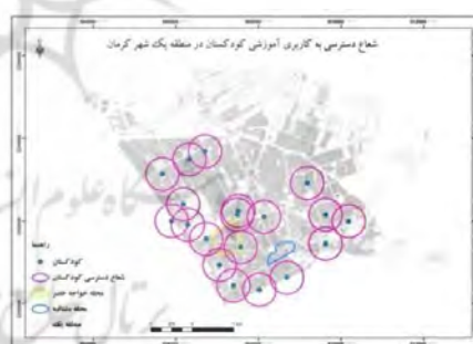
شکل ۱۰- شعاع عملکرد کاربری کودکستان در منطقه یک