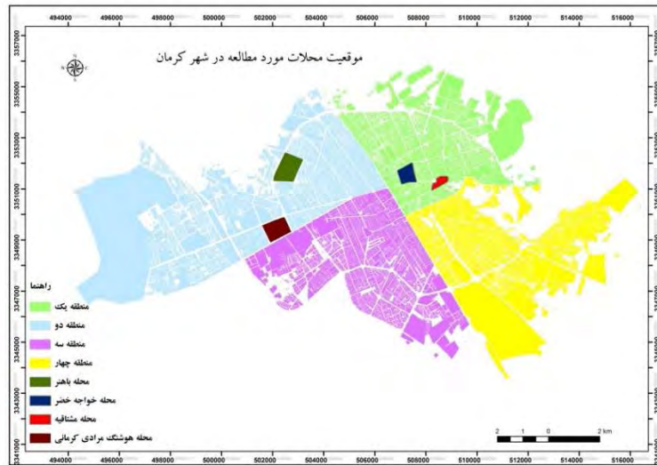
شکل ۱- موقعیت محلات مورد مطالعه در شهر کرمان