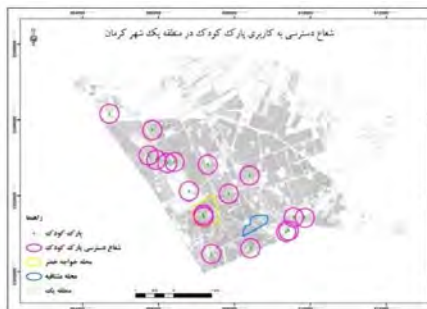
شکل ۱۲- شعاع عملکرد کاربری پارک کودک در منطقه یک