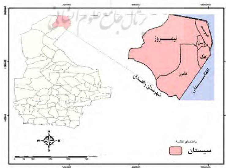
شکل ۳. موقعیت جغرافیایی شهرستان‌های منطقه سیستان