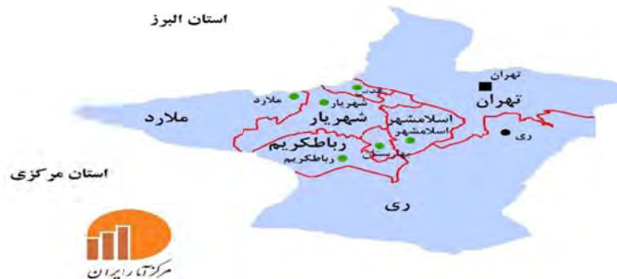
شکل شماره (۱): نقشه موقعیت جغرافیایی شهر شه‌ریار (مرکز آمار ایران، ۱۳۹۹).

در این پژوهش، شاخص‌ها به صورت تلفیقی و با توجه به متغیرهای اصلی (سرقت خودرو و توقفگاه محلی) و نیز سوابق پژوهش‌های صورت گرفته، با استفاده از مصاحبه کوتاه و جلب نظریات کارشناسان و مدیران شهری شه‌ریار و خبرگان نیروی انتظامی، همچنین تمایل مالکین برای سرمایه‌گذاری و واگذاری مشروط اراضی برای تبدیل به توقفگاه عمومی محلی، دسته‌بندی شده‌اند که بر رویکردها و نظریه‌های پیشگیری از جرم، مکان‌یابی و اکولوژی اجتماعی تکیه دارد. علت انتخاب این شاخص‌ها، تأثیرگذاری آن‌ها در دو مقوله تسهیل در احداث و دسترسی به توقفگاه محلی و پیشگیری از سرقت خودرو بوده است. عمده شاخص‌های کاربردی این پژوهش شامل: تراکم جمعیتی و شهرسازی محله‌ها، مالکیت (عمومی و خصوصی)، بایر بودن اراضی به مدت (۵) سال، دسترسی‌پذیری، اراضی بالای (۳۰۰) مترمربع و نیز اولویت‌های شدآمدی مسئولین و کارشناسان نیروی انتظامی و شهرداری شه‌ریار می‌باشد.