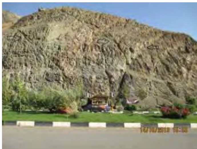
شکل ۴: وجود آثار سیستم های گسلی در منطقه که تأثیر پذیری سطح حوضه را از عوامل تکتونیکی نشان می دهد (مکان جاده اوشان به تهران در محدوده حوضه مورد بررسی).