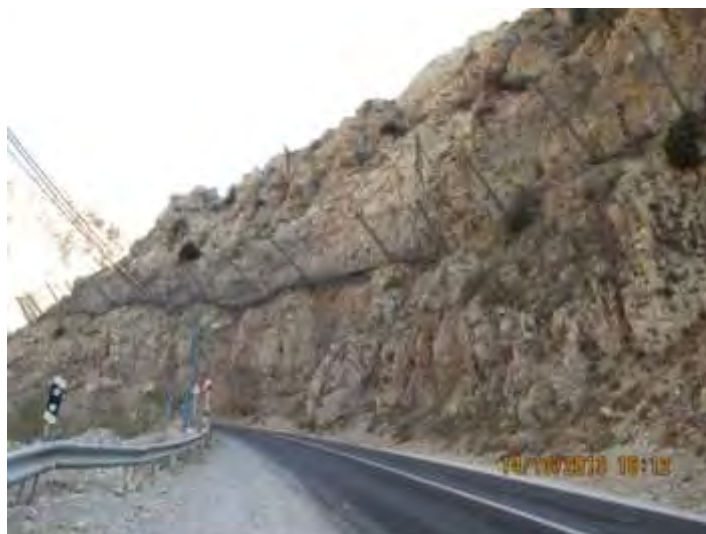
شکل ۳: سنگ‌های شکسته بر روی دامنه‌های فعال و سازه‌های محافظتی ژئوتکنستالی (مکان جاده شمشک به تهران در محدوده حوضه آبریز).