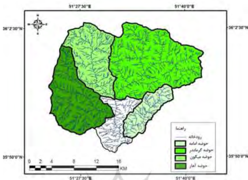
شکل ۵: زیرحوضه های حوضه آبریز رودک به ترتیب از راست پایین به چپ امامه، گرمابدر، میگون و آهار جدول ۱: ویژگی های فیزیکی زیرحوضه های مورد مطالعه