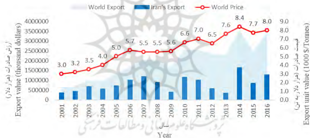
شکل ۲- ارزش صادرات ایران و قیمت صادرات جهانی، ۲۰۰۱-۲۰۱۶ Figure 2- Iran's export value and export unit value, 2001-2016 مأخذ: فائو (۱۸) Source: FAO

کشورها استفاده شد. فرم پایه و تئوریک الگوی جاذبه به صورت رابطه‌ی (۱) می‌باشد: