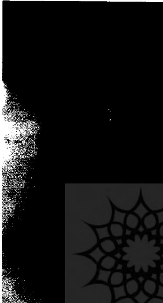
ت ۴. میرزا ابراهیم صحاف‌باشی (مهاجر) طهرانی، تصویر از روی جلد نامهٔ وطن، نشریه‌ای که صحاف‌باشی در تبعید در هند منتشر می‌کرد، است. مأخذ: همان، ص ۱۲۵

میرزا ابراهیم‌خان عکاس‌باشی در تمامی سفرهای شاه به فرنگ حضور داشت و عکسها و فیلمهای خوبی نیز تهیه کرد. در یکی از سفرها چاپخانه‌ای سیار برای خود خرید و در تهران مطبوعهٔ خورشید را راه انداخت و کتابهای گوناگونی به چاپ رساند. عکاس‌باشی پس از وفات مظفرالدین‌شاه (ذیقعه ۱۳۲۴ق/ دی ۱۲۸۵ش/ ژانویه ۱۹۰۷م) دربار را ترک کرد و تا سال وفات (۱۲۹۴ش) به کشاورزی در کرج و گیلان پرداخت. ۷