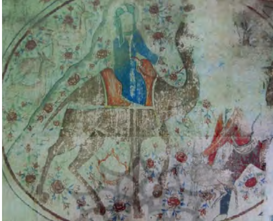
تصویر ۱۲: امام رضا(ع) در حال شفاعت آهو؛ بقعه آقا سیدرضا داور کیا در بیجار بنه لاهیجان

تاج‌الدین حسن بن سلیمی تونی (متوفای ۸۵۴ق)، نظیری نیشابوری شاعر قرن دهم و یازدهم قمری، محمد یزدی متخلص به «جیحون» شاعر قرن سیزدهم و غیره داشته است. در این اشعار، امام رضا(ع) به عنوان ضامن آهو نام برده شده است (میرآقایی، ۱۳۹۱: ۱۵-۱۸). این موتیف منبع الهام هنرمندان نقوش دیواری، نقاشی قهوه‌خانه‌ای، نگارگری و مینیاتور شد.