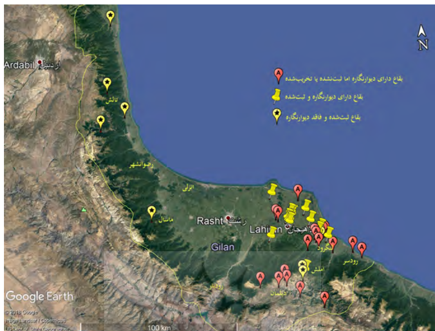
نقشه ۲: مکان‌یابی بقاع شاخص در نقشه گیلان