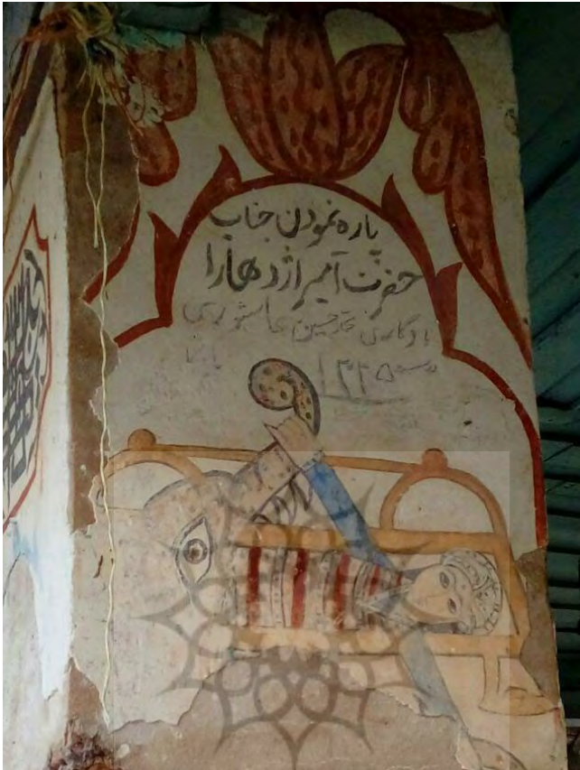
تصویر ۱۰: حضرت علی (ع) در حال جنگ با ازدها؛ بقعه آقا سید محمد یمنی در لیچا لشت نشا، (عکس از نگارندگان)