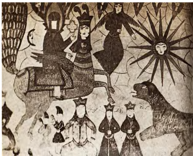
شکل ۵: معراج پیامبر در بقعه آقا سیدمحمد؛ در روستای پینچا آستانه اشرفیه (ستوده، ۱۳۷۴: ۱۸۸)