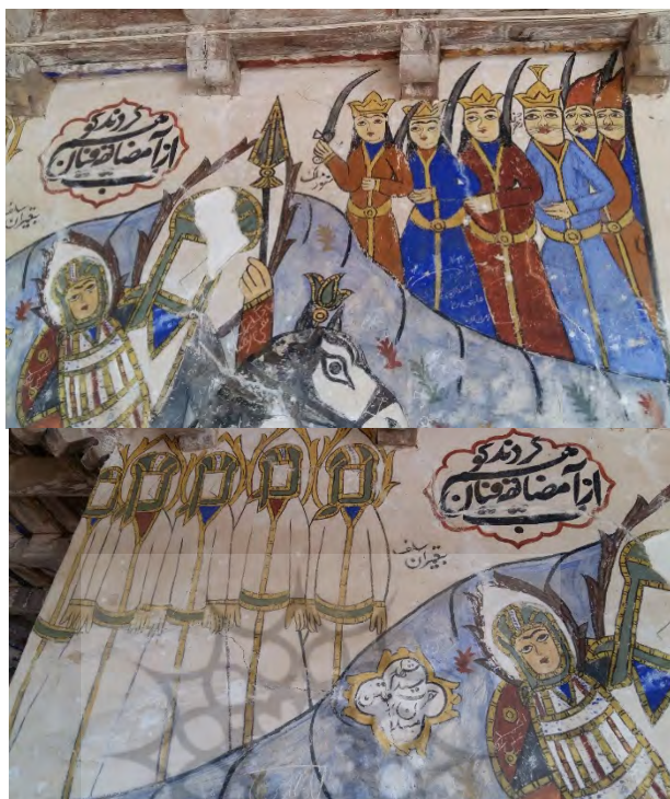
تصویر ۱: حضور پیامبران، فرشته‌ها و اجنه برای یاری دادن به امام حسین (ع). بقعه آقا سیدابراهیم، روستای باباجان دره، املش