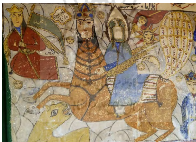
شکل ۶: معراج پیامبر، بقعه امامزاده ابراهیم در روستای باباجان دره املش