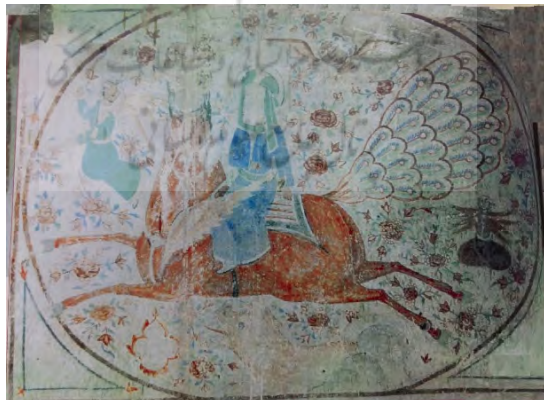
تصویر ۴: نقش معراج پیامبر سوار بر براق، در بقعه آقا سیدرضا داور کیا؛ در بیجار بنه لاهیجان

در اینجا این سؤال به ذهن می‌رسد که نقش معراج پیامبر(ص) در کنار نقش امام حسین(ع) و واقعه کربلا نشانه چیست؟ فضایل و کرامات زیادی به امام حسین(ع) نسبت داده‌اند؛ از جمله نزول جبرئیل بر پیامبر(ص) برای تبریک فرزندی که به دست امتش شهید می‌شود. یا آوردن خاک کربلا برای پیامبر(ص) در وصف مکانی که کودک نورسیده در آن به شهادت خواهد رسید و ناراحتی فرشتگان نزد پرودگار برای شهادت مظلومانه این کودک. همچنین در باوری ویژه و خاص نزد شیعیان بخش‌هایی از اندونزی، ارتباطی میان شهادت امام حسین(ع) و اسراء حضرت رسول(ص) در قالب اندیشه حضور براق مرکوب حضرت، نمود یافته است. بر پایه این باور، با شهادت و جدا شدن سر امام حسین(ع)، براق حضور می‌یابد و سر را به سمت بهشت حمل می‌کند، اما یاران حضرت به دلیل عشق به امام مانع از این کار می‌شوند. براق با دیدن این علاقه، سر را نزد آنان بازمی‌گرداند (حاج منوچهری، ۱۳۹۱: ۶۸۱، ۶۸۹). بدین ترتیب، این روایات باعث شده تا نقاش در ذهن خود، واقعه کربلا را به گونه‌ای با معراج پیامبر(ص) ارتباط دهد.