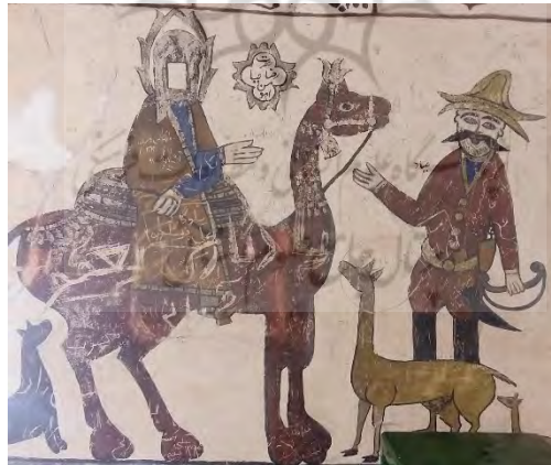
تصویر ۱۳: امام رضا(ع) در حال شفاعت آهو؛ امامزاده ابراهیم در روستای باباجان دره املش (عکس از نگارندگان)