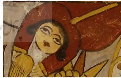
تصویر ۸: آرایش قاجاری در تزئین چهره براق و فرشتگان و اجرام سماوی، معراج پیامبر؛ بقعه امامزاده ابراهیم در روستای باباجان دره املش