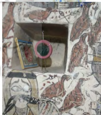
تصویر ۳: بقعه آقا سیدحسین در لاهیجان