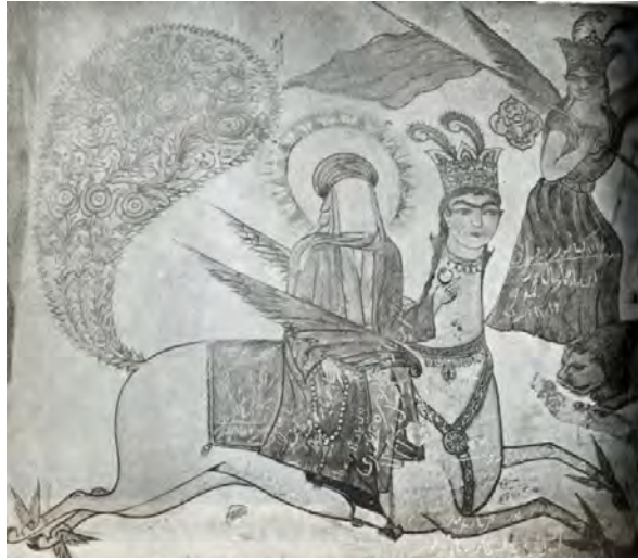
شکل ۷: معراج پیامبر بر دیوار خارجی بقعه بابا ولی دیلمان (ستوده، ۱۳۷۴، تصویر شماره ۲۰: ۵۷).