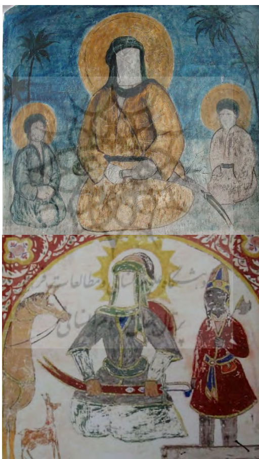
تصویر ۹: حضرت علی(ع) به همراه شمشیر ذوالفقار؛ بقعه آقا سیدحسین در لنگرود

اسلامی، حضرت علی(ع) است. نگاره نبرد حضرت علی(ع) با اژدها، مربوط به نسخه خاوران‌نامه ابن حسام است که به تقلید از شاهنامه فردوسی، در زمان قراقویونلوها سروده شده است. از نظر شیعیان، حضرت علی(ع) دارای شخصیتی عظیم، متعالی و چندبُعدی است. در این نسخه، در کنار بُعد حقیقی شخصیت حضرت، بُعد اسطوره‌ای او نیز نشان داده شده و به نظر می‌رسد هدف از بیان داستان‌ها، تحکیم ایمان مردم و برانگیختن حس تحسین شیعیان و دوستان آل علی(ع) بوده است که بنا به پسند عوام، در آن روزگار در کنار حوادث تاریخی، سخن از جنگ با اژدها و دیو نیز به میان آمده است (مهدی‌زاده، ۱۳۹۵: ۴۲).