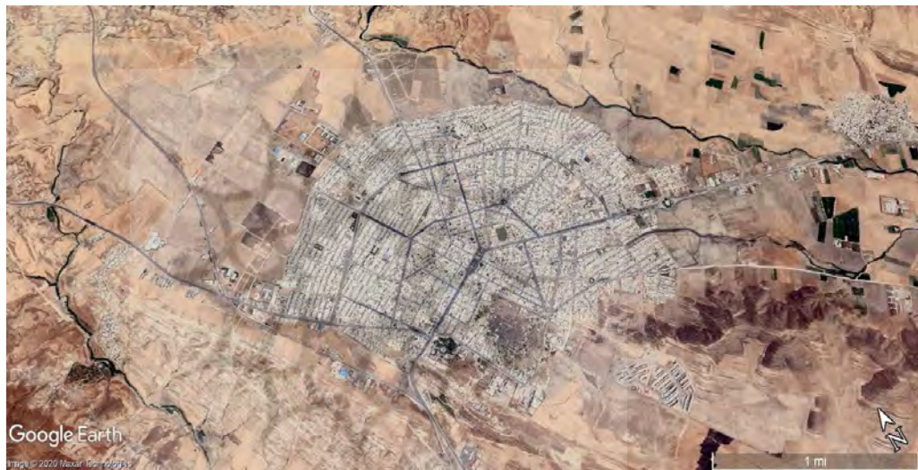
تصویر ۴. تغییر مرکزیت از بهبهان به دهدشت در دوره صفوی.

در دوره‌های تیموری تا قاجاریه، نواحی ساحلی خلیج فارس به‌عنوان بخشی از فرمانداری کهگیلویه سامان یافت (رهربرن، ۱۳۴۹: ۱۵-۱۳). در دوره «شاه محمد خدابنده» است که بهبهان (ارجان) دیگر مرکز بیگلربیگی نیست و دهدشت مرکز بیگلربیگی کهگیلویه می‌شود (گاوبه، ۱۳۷۷: ۱۵۳)، (تصاویر ۴ و ۵). طبق مطالب فوق‌الذکر، نام‌هایی چون «قبادخوره» و «ارجان» از میان رفت و نام «کهگیلویه» به تمامی نواحی تحت پوشش ارجان، اهواز، دزفول، شوشتر و بصره اطلاق شد (رهربرن، ۱۳۴۹: ۱۵-۱۳). در دوره قاجار، باتوجه به این‌که احتشام‌الدوله، قنات ناصری را برای منطقه منصوبه ایجاد می‌کند، احتمال می‌رود که هسته اصلی شهر بهبهان در منطقه منصوبه امروزی بوده باشد. در تاریخ ۱۳۴۲/۴/۲۲ به پیشنهاد «ارتشبد آریانا» و تصویب هیأت دولت و «محمدرضا پهلوی» کهگیلویه از بهبهان جدا شد و به‌صورت فرمانداری کل، و بهبهان نیز به‌عنوان یکی از شهرستان‌های استان خوزستان درآمد (مختاران، ۱۳۹۴: ۶۹).