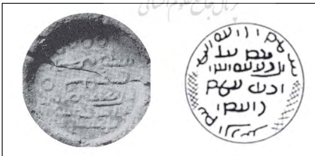
تصویر ۱. مهر آمارگر دوره ساسانی که در آن نام به‌از‌آمد‌کواد مشاهده می‌شود (Miri, 2012: 137).

درخصوص ایجاد این خوره توسط قباد اول، تقریباً بین همه مورخان و جغرافی‌دانان اتفاق نظر وجود دارد؛ به جز ثعالبی که آن‌را به شاپور اول منتسب می‌کند. اما درخصوص نام واقعی آن اختلاف نظرهایی وجود دارد که در اینجا به آن‌ها پرداخته خواهد شد. حمزه‌اصفهانی این شهر را «به-از-آمد-کواد» ذکر می‌کند (حمزه‌اصفهانی، ۱۳۴۶: ۱۲۰). دینوری نام این منطقه را «ابرقباد» ذکر می‌کند (دینوری، ۱۳۷۱: ۸۰). طبری اشاره می‌کند که این شهر قبل از این اسم (ارجان) «رام‌قباد» نام داشت و همان است که «برم‌قباد» گویند (طبری، ۱۳۶۲: ۶۴۱). اشاره طبری به دو نام رام‌قباد و برم‌قباد، منجر به این شد تا برخی پژوهشگران این دو نام را به ناحیه‌ای بزرگ و وسیع نسبت دهند (نیستانی، ۱۳۷۴: ۸۴). «شوارتس» و «مارکوارت» نام به-از-آمد-کواد را قدیمی‌ترین نام این رستاق دانسته‌اند و این نام را پذیرفته‌اند (شوارتس، ۱۳۷۲: ۱۵۰؛ مارکوارت، ۱۳۷۳: ۱۳۰). اگر گفته «فرانتس آلتهایم» (۱۳۹۱: ۱۹) را بپذیریم که معتقد است زمانی که اردشیر بابکان از این منطقه عبور می‌کرده، به نام ارجان اشاره می‌کند؛ نظر شوارتس و مارکوارت را نمی‌توان قابل قبول دانست. بر روی برخی از مهرهای اداری عصر ساسانی علامت WYHC دیده می‌شود که پژوهشگران آن‌را مربوط به «به‌از‌آمد‌کواد» می‌دانند (Miri, 2012: 99; Daryaei, 2003: 195; Gyselen, 1988). همچنین، شواهد سکه‌شناختی نشان