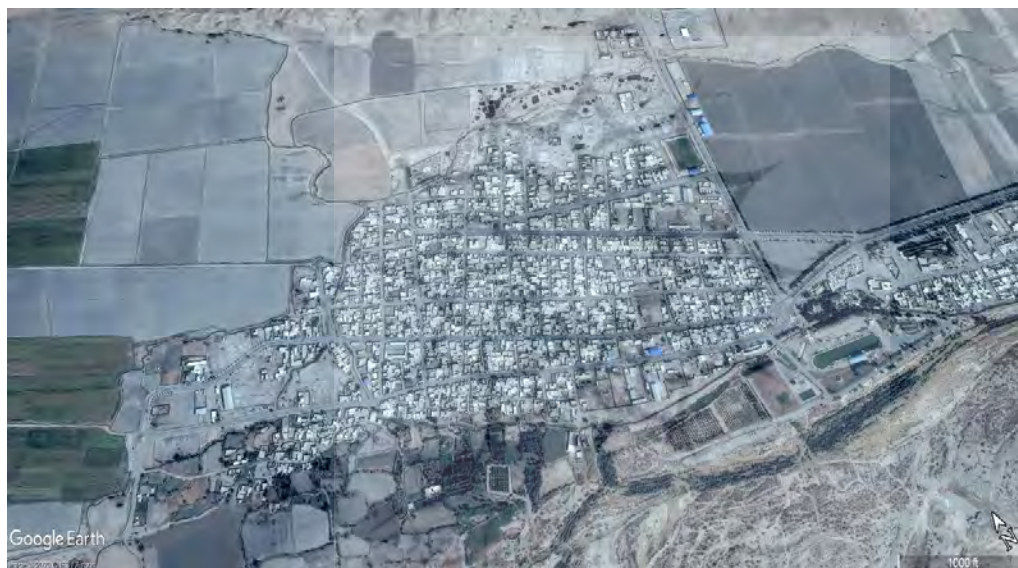
تصویر ۲. عکس هوایی منطقه زیدون (Google Earth, 2020).

«خواجه رشیدالدین فضل‌الله همدانی» از منطقه وابسته به خوره ارجان چنین یاد کرده است: «جبل جیلویه و زیتان و رامز و دورق به معرفه خواجه جمال‌الدین عدل صدرزیتان» (همدانی، ۱۳۵۸: ۲۱۰)؛ در این نوشته، نامی از ارجان مشاهده نمی‌شود، کهگیلویه و زیتان (زیدون امروزی)، (تصویر ۲) جایگزین مرکز اداری ارجان شده است.