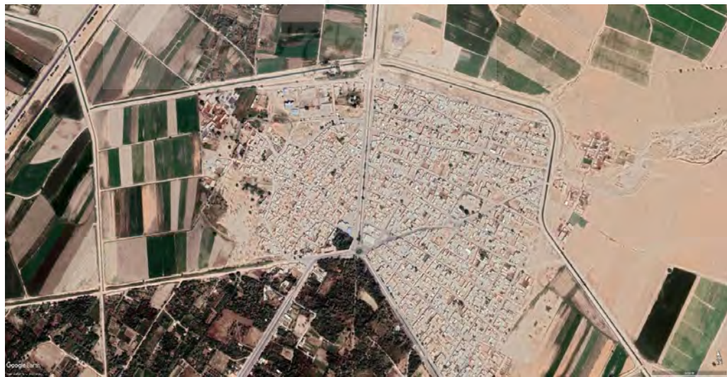
تصویر ۵. موقعیت احتمالی بهبهان در دوره قاجار (Google Earth, 2020).