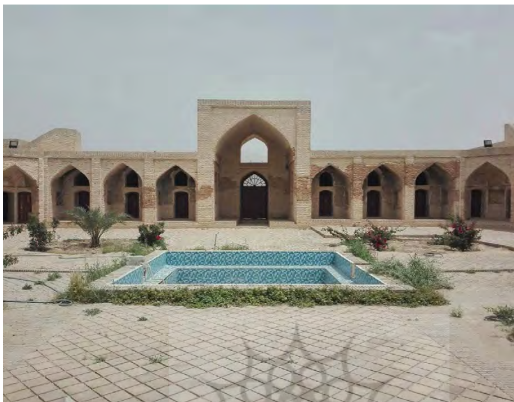
تصویر ۳. قلعه مدرسه خیرآباد (نگارنده، ۱۳۹۷).

تمام بداد» (حسینی فسایی، ۱۳۶۷: ۵۰۴). در خصوص خود شهر و وضعیت اقتصادی آن در این دوران اطلاعات چندانی در دست نیست. «کریم خان زند» در سال ۱۱۷۳ ه.ق. احتمالاً برای کنترل آسان و بهتر کهگیلویه و بهبهان، آن را به دو بخش تقسیم نمود. قسمت بهبهان و زیرکوه را به فردی به نام «علی رضاخان قنوتی بهبهانی» محول کرد و مناطق کهگیلویه و پشت کوه آن را به «هیبت الله خان باوی» سپرد (همان: ۶۰۱). «میرزا علیرضاخان»، فرزند میرزا قوام الدین که با قنوتی‌ها اختلاف داشت، به دشمنی با کریم خان و به جنگ با سپاه زند برخاست. در این جنگ قنوتی‌ها و هیبت الله خان باوی، کریم خان را همراهی می‌کردند و بهبهان آسیب فراوان دید. از آن پس، این وقایع تنش بین دو بخش قنوت و بهبهان را افزایش داد (سیاهپور، ۱۳۹۵: ۱۲۷-۱۲۵؛ حسینی فسایی، ۱۳۶۷: ۶۰۲ و مختاران، ۱۳۹۴: ۳-۸۱). بهبهان تا دوره «ناصرالدین شاه قاجار» کمافی السابق دست به دست می‌شد و جنگ بین سران قبایل کهگیلویه‌ای‌ها و بهبهانی تاحدودی برقرار بود و بیشترین گزارش‌ها مربوط می‌شود به گزارش همین جنگ‌ها و از اوضاع اقتصادی-اجتماعی بهبهان که چندان گزارشی در دست نیست (حسینی فسایی، ۱۳۶۷: ۶۰۵)؛ اما با روی کار آمدن ناصرالدین شاه و صدارت «امیرکبیر»، شیوه نوینی در اداره ایالات و ولایات ایجاد شد که بهبهان و کهگیلویه از آن مستثنی نبود. از جمله حاکمان خیرخواه و دلسوز قاجاری که در دوره ناصرالدین شاه حکومت کهگیلویه و بهبهان را به دست گرفتند و کارهای عمرانی و عام‌المنفعه بسیار انجام دادند، «احتشام‌الدوله» بود؛ اقدامات وی موجب آرامش و سامان بخشی ولایت گردید و تعامل سازنده‌ای میان ایلات و عشایر منطقه و حکومت مرکزی ایجاد کرد (سیاهپور، ۱۳۸۶: ۱۳۸-۱۲۳).