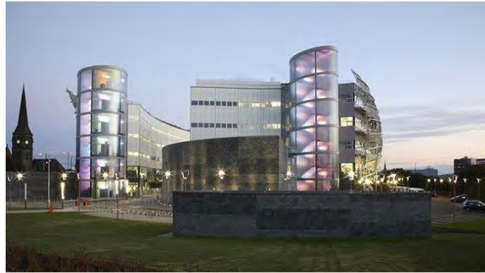
شکل ۴. تصاویری از ساختمان پایدار پردیس دانشگاهی بریتانیا (دیجی کالا، ۱۳۹۴)

بخشی از «دانشگاه نورثاومریا» (Northumbria University) انگلستان به نام کمپ شرقی خوانده می‌شود. این کمپ خاستگاه یکی از نخستین بناهای اروپا است که بر اساس استانداردهای زیست‌محیطی ساخته شده است. پس از آنکه پروتکل کیوتو در سال ۱۹۹۷ م. (۱۳۷۶ ه.ش.) کاهش گازهای گلخانه‌ای و مبارزه با تغییرات جوی را الزامی دانست، دست اندرکاران این پروژه شروع به ساخت پردیسی متفاوت کردند. این مجموعه در سال ۲۰۰۷ م. (۱۳۸۶ ه.ش.) تکمیل شد و در حال حاضر خوابگاه بیش از ۹ هزار دانشجو است. در سال ۲۰۱۱ این ساختمان به دلیل کاهش تولید گاز دی‌اکسید کربن موفق به دریافت جایزه‌ای تحت همین عنوان شد.