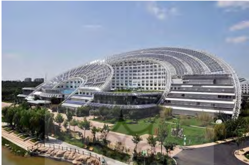
شکل ۲. تصاویری از ساختمان پایدار عمارت ماه و خورشید

عمارت خورشید و ماه بزرگترین بنای خورشیدی جهان در ۲۷ نامبر سال ۲۰۰۹ در منطقه دزهو (ایالت شانگدون در شمال غرب چین) است. این بنا در ۷۰۵ هکتار ساخته شده که شامل یک ساختمان اداری، یک هتل، یک نمایشگاه و یک سالن اجلاس می باشد. که کل آب گرم مجموعه توسط آبگرمکن های خورشیدی تأمین می شود. این ساختمان یک مکعب مستطیل ساخته شده ولی بام این ساختمان پوشش نیم دایره ای دارد که صرفاً جهت کار گذاشتن پنل های خورشیدی می باشد.