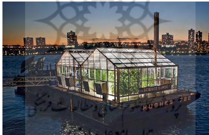
شکل ۵. تصاویری از ساختمان پایدار خانه‌ی متحرک نیویورک (دیجی کالا، ۱۳۹۴)

خانه‌ی متحرک نیویورک که از آن با نام «کشتی علم» (Science Barge) هم یاد می‌شود در واقع یک کلاس درس آموزشی و یک خانه‌ی سبز منطبق با اصول زیست‌محیطی است که منطبق با ضوابط هیئت ساختمان‌سازی سبز تجهیز و سازماندهی شده است. سوخت لازم برای این مجموعه از نور خورشید، باد و سوخت‌های بیولوژیکی تامین می‌شود. این بنا در سال ۲۰۰۷ م. (۱۳۸۶ ه.ش.) ساخته شده و به واسطه طراحی منحصر بفردش در عمل هیچ گاز دی‌اکسید کربنی از آن به خارج منتشر نمی‌شود.