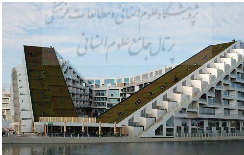
شکل ۳. تصاویری از ساختمان پایدار مرکز تجاری کپنهاگ (دیجی کالا، ۱۳۹۴)

پشت بام های سبز این شهرک می تواند باعث انعکاس امواج مضر خورشید و خنک شدن هرچه بیشتر محیط شود. این شهرک در حومه شهر واقع شده و برای دسترسی به آن تنها ۱۰ دقیقه زمان کافی است تا یک مسافر بتواند از شهر کپنهاک خود را به این مجموعه برساند. این شهرک عظیم ۵۰۰ واحدی یک مجتمع بزرگ تجاری را نیز در خود جای داده است. از آنجا که ساکنان می توانند کلیه خریدهای خود را از این محل انجام دهند لذا از میزان مصرف بنزین نیز به شدت کاسته شده است. شهرک در سال ۲۰۱۰ م. (۱۳۸۹ ه.ش.) رسماً افتتاح شد. در این شهرک ۱۸ هزار فوت مربع (برابر با ۱۷۰۰ متر مربع) پشت بام سبز تعبیه شده که می تواند باعث انعکاس امواج مضر خورشید و خنک شدن هرچه بیشتر محیط شود.