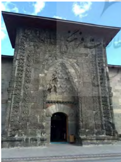
تصویر ۲- سردر مدرسه یاقوتیه.