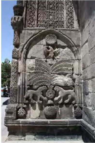
تصویر ۴- نقش مایه درخت زندگی در سردر مدرسه چیفته مناره، ارزروم (نگارنده).