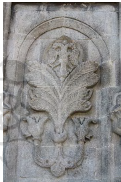
تصویر ۶- نقش مایه درخت زندگی در سردر مدرسه چفته مناره، ارزروم.

سماچتین بر این باور است که ریشه نقش مایه درخت زندگی، در مفهوم جهان و برکت، در هنر این دوره به تاثیر باورهای آسیای میانه بازمی‌گردد (Çetin, 2012: 11,14).