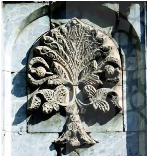
تصویر ۵- نقش درخت زندگی بر سردر ورودی گوک مدرسه شهر سیواس، ۱۲۷۱ م. (URL1).

این سردر مزین به نقوشی است که از بطن تاریخ فرهنگی، اجتماعی و دینی مردمان این منطقه سرچشمه می‌گیرد. عمده تزیینات به کاررفته در این بنا، حجاری روی سنگ است که بر روی ستون‌ها، سردر وردی اتاق‌های درس و دیگر بخش‌ها با تنوع بسیار، کار شده است. اما اصلی‌ترین تزیینات بنا در سردر ورودی بنا به چشم می‌خورد. در دو سمت سردر ورودی مدرسه، قاب‌هایی در دیوار به صورت قوسی شکل تعبیه شده است. در داخل این قاب‌ها، نقش برجسته‌ای وجود دارد که درخت زندگی با فرم برگ‌های درخت نخل از داخل یک گلدان سربرآورده است (تصویر ۴). تعداد شاخه‌های این درخت در مجموع شانزده عدد می‌باشد. بر روی شاخه‌ها میوه‌هایی دیده می‌شود. در دو طرف درخت زندگی، تصویر دو شیر و در بالای آن، نقش مایه عقاب دوسر وجود دارد. «این نقش مایه با گذشت زمان و حوادث طبیعی به صورت عقاب تک سر درآمده است» (Ağaç, 2015: 10).