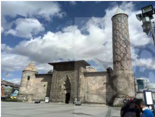
تصویر ۱- نمای کلی مدرسه یاقوتیه و سردر ورودی (نگارنده).

170-167: 2006). تزیینات به‌کار رفته در سردر ورودی این مدرسه، به شکل حجاری بر روی سنگ، چشم نواز و خیره کننده است. نمونه همین تزیینات را در دیگر سردرهای دوره سلجوقی و ایلخانی می‌بینیم. این بنا یک مدرسه چهار ایوانی با حیاط مربع مستطیلی است و صحن آن دارای طاق مرکزی مقرنس کاری با روزن گردی است. سه ایوان و چهارده حجره به این صحن باز می‌شود. در جبهه غربی مدرسه، سردر قرار دارد که از بدنه بنا، بیرون زده است. در محور جبهه شرقی، قاعده مکعبی شکلی با مناره استوانه‌ای خودنمایی می‌کند. مناره‌ها در اطراف سردر ورودی واقع نشده؛ بلکه به گوشه‌های بنا رانده شده‌اند. احتمال می‌رود یکی از مناره‌های موجود در سمت چپ بنا یا از بین رفته و یا اصلاً ساخته نشده است (تصاویر ۱ و ۲).