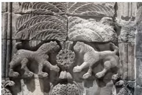
تصویر ۸ - نقش مایه شیر در اطراف درخت زندگی، مدرسه یاقوتیه (نگارنده).

به اعتقاد کاترینا اتنو دورن ۱۵ شیر در نقش محافظ میوه‌های درخت مقدس از تداوم یک سنت قدیمی خبر می‌دهد. در هنر هند، بین‌النهرین باستان و هنر ایران نیز شیر به عنوان نماد خورشید و محافظ دروازه آسمان به‌کار رفته است. در بناهای یادبود و دروازه ورودی شهرهای سلاجقه نیز نقش شیر با کاربرد محافظ خبر از یک سنت باستانی دارد. مجسمه شیر در شهر و بناهای قرون وسطی با نقش محافظ در برابر نیروهای بد و پلیدی که از بیرون وارد می‌شوند، روی درهای ورودی و جبهه خارجی بناها کار شده است (Peker, 1996: 30-3).