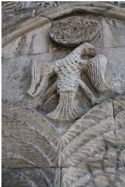
تصویر ۷ - نقش عقاب دوسر (تغییر شکل یافته) بر بالای درخت زندگی، مدرسه یاقوتیه.

شمن نیز هست. چون که شمن به واسطه درختی که زمین و آسمان را به هم مرتبط می‌سازد، به آسمان راه یافته و به اوج می‌رسد. در کنار این مفاهیم، نماد روشنایی و خورشید نیز تلقی می‌گردد (Ibid).