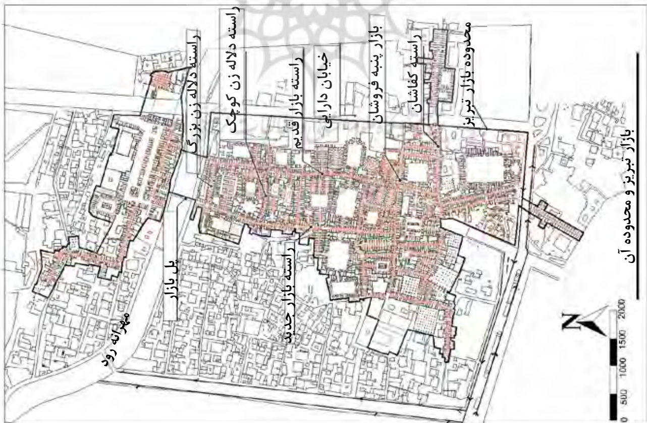
تصویر ۱. موقعیت بازار تبریز.

بیان شده دارد. این امر باعث شده، مسیرها و راسته‌هایی با هم‌پوشانی بالا، دارای کالاهای مرغوب‌تر و پرقیمت‌تر نسبت به سایر قسمت‌ها بوده و تفکیک در بازار، اجناس و در نتیجه راکد و کم‌اعتبار شدن قسمت‌های دیگر و منفک‌شدن بازار به عنوان یک کل و مجموعه، اتفاق افتاده و از میزان جابجایی مردم در این محورها کاسته شود. با توجه به جدول ۳، بیشترین میزان انتخاب در خیابان دارایی و ورودی به سرا اتفاق می‌افتد، که این امر هم نشان از اهمیت این خیابان برای عبور و مرور مردم و ورود به بازار دارد. با توجه به نتایج نشان داده شده، بیشترین میزان انسجام و اتصال در قسمت جنوبی راسته‌های قدیم و جدید و نقطه اتصال این دو راسته صورت می‌گیرد. با توجه به تصویر ۳، می‌توان چنین استنباط کرد که با تغییر تدریجی در محوطه اطراف بازار، اهمیت محورهای اصلی از بین رفته و نوعی افتراق در عملکرد بازار روی داده است. جهت بررسی دقیق علت‌های اصلی اجتماع‌پذیری و عوامل اصلی در کاهش آن، در قسمت‌های انتهایی و شمالی بازار تبریز با استفاده از روش اندازه‌گیری میدانی، دیدگاه مردم، بازاریان و کسبه مورد ارزیابی قرار گرفت. با توجه به نقش اجتماعی قوی بازار در شهر، ساختار کالبدی و عملکردی آن در ایجاد حس اجتماعی بسیار تأثیرگذار است. با توجه به کیفیت طراحی، عوامل کالبدی در ایجاد کیفیت مناسب فضاها،