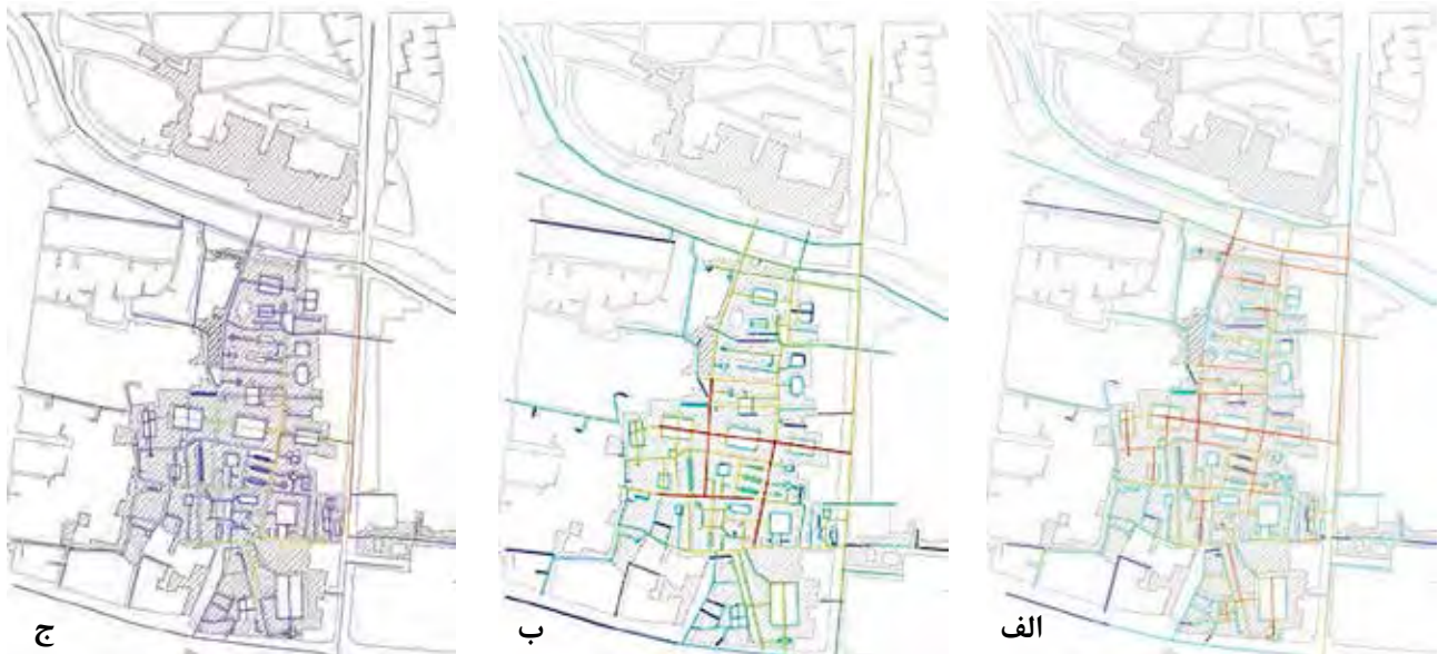
تصویر ۲. نقشه سگمنت، الف: ارتباط، ب: انتخاب، ج: انسجام در بازار تبریز.

ترکیب فضاهای پر و خالی (باز و بسته و نیمه‌باز)، ترکیب و تنوع کاربری‌ها، بهبود معانی فعالیت‌ها، برطرف ساختن نیاز کاربران، استفاده از هندسه متناسب با نیاز فضایی، تناسب ویژگی‌های فضا با ارزش‌های فرهنگی بومی و ایجاد پیوستگی با شهر باعث ایجاد تعامل و روابط مناسب اجتماعی در بازار می‌شود. اما عوامل عملکردی شامل ایجاد ارتباط مناسب با مراکز فرهنگی، اجتماعی و مذهبی بازار در ساختار اقتصادی و ایجاد فضای چند عملکردی، استفاده از نظام تشکلی و صنفی، ایجاد فضایی فعال برای انجام مراسمات و برگزاری آیین‌های مختلف در بازار، امکان حضور مردم و بازاریان را در آن فراهم ساخته و زمینه‌ساز فعالیت‌های اجتماعی می‌شود. ارتباط مناسب مردم با بازار به واسطه سلسله مراتب فضایی مناسب با فضای شهرهای ایرانی، زمینه‌ساز برای مشارکت مردم در سازماندهی فضای شهری و برگزاری بسیاری از مراسم‌های مهم شهری است. بنابراین در تعریف شاخص، به دو عامل مهم کالبدی و عملکردی بازار، با رجوع به مبانی نظری و داده‌های به دست آمده از تکنیک نحو فضا، در جدول ۴ اشاره می‌شود.